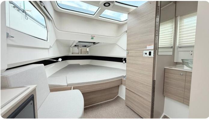
Saxdor 320 GTO Cabin