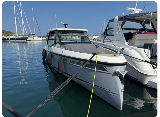
Saxdor 320 GTO Fwd Profile