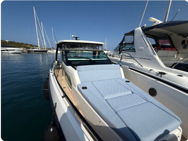
Saxdor 320 GTO Bow