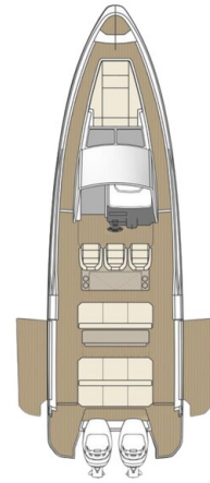
Saxdor 320 GTO Layout