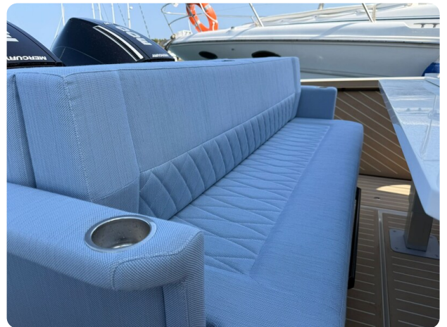
Saxdor 320 GTO Aft Seats