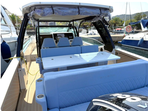
Saxdor 320 GTO Aft View