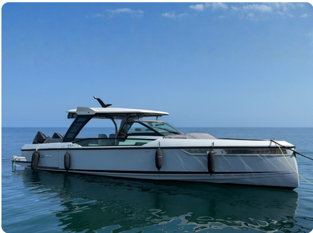
Saxdor 320 GTO Profile