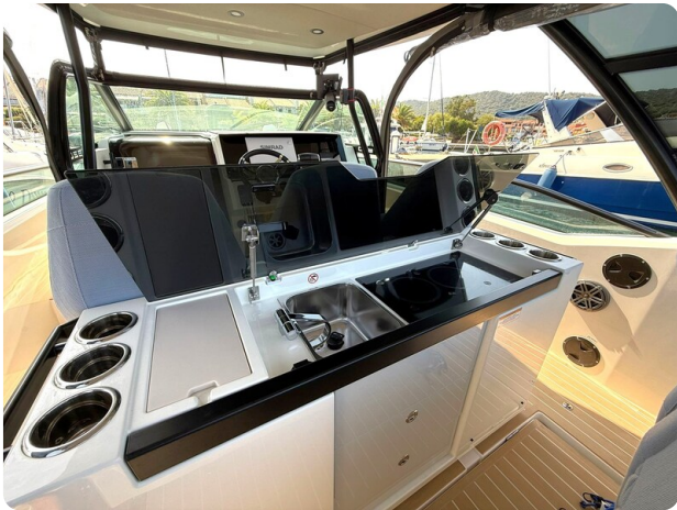
Saxdor 320 GTO Galley