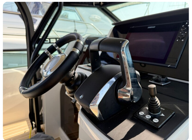
Saxdor 320 GTO Helm console detail