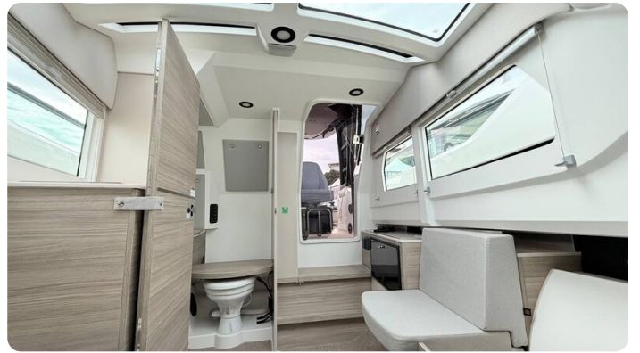
Saxdor 320 GTO Cabin Detail