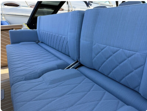
Saxdor 320 GTO Galley Seats