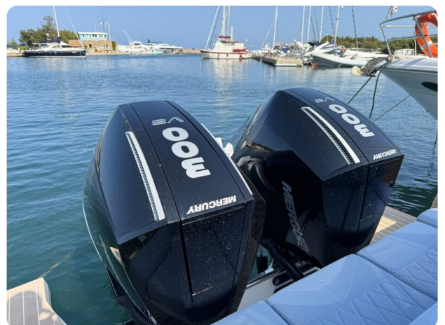
Saxdor 320 GTO Outboards