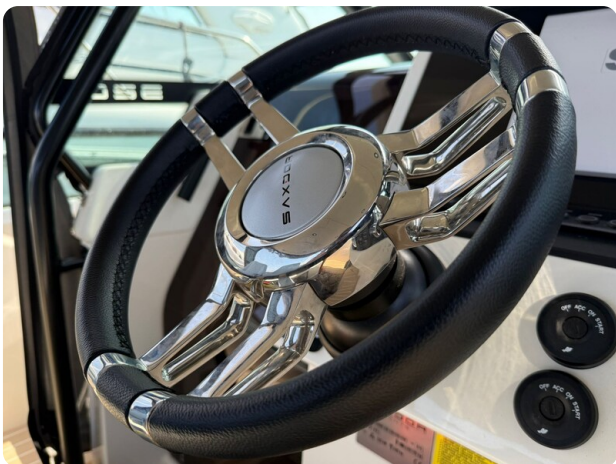
Saxdor 320 GTO Wheel