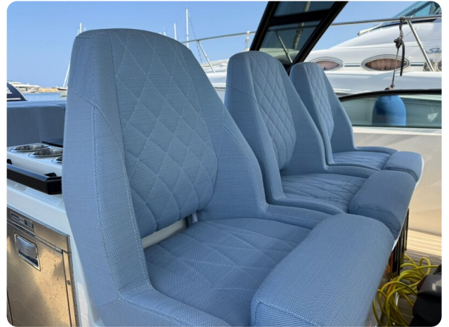
Saxdor 320 GTO Front Seats