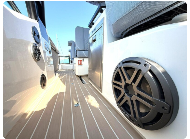
Saxdor 320 GTO Audio System