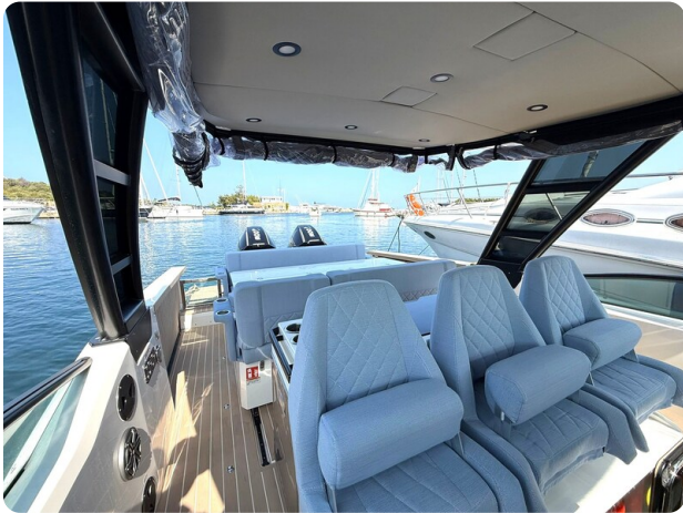
Saxdor 320 GTO Cockpit