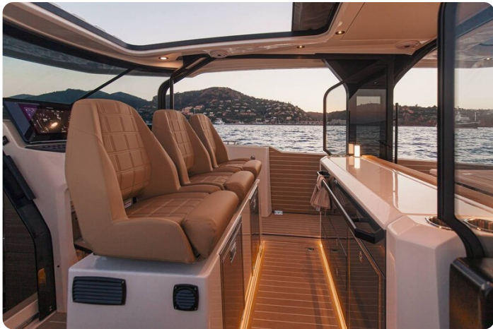
SAXDOR 400 GTS Galley detail