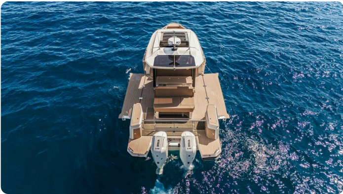
SAXDOR 400 GTS Aft aerial