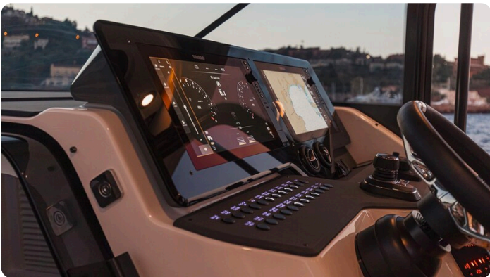
SAXDOR 400 GTS Helm