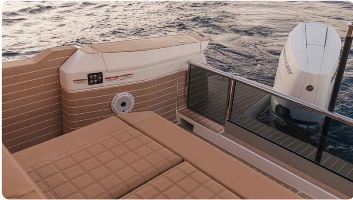
SAXDOR 400 GTS Aft detail