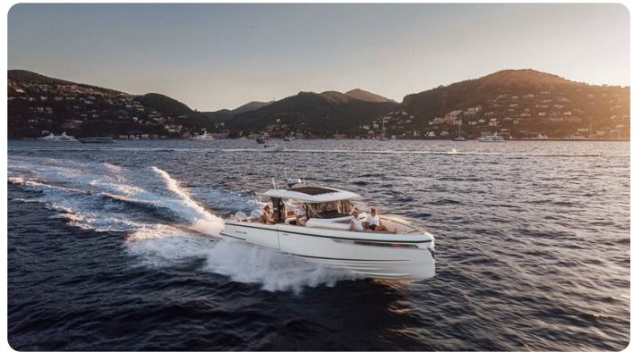
SAXDOR 400 GTS Cruising