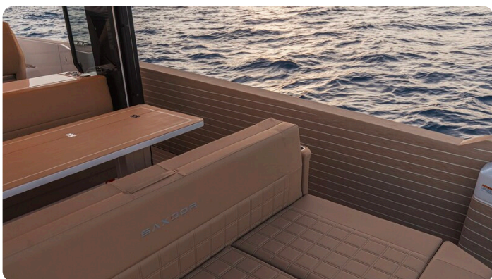
SAXDOR 400 GTS Aft sunbed