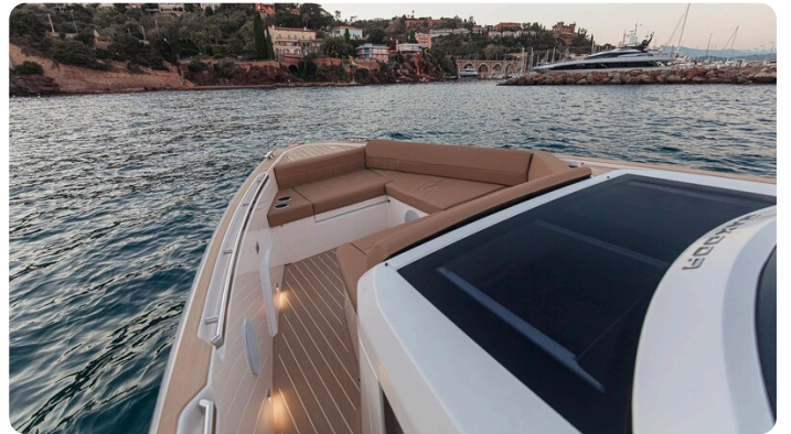
SAXDOR 400 GTS Bow sunbed