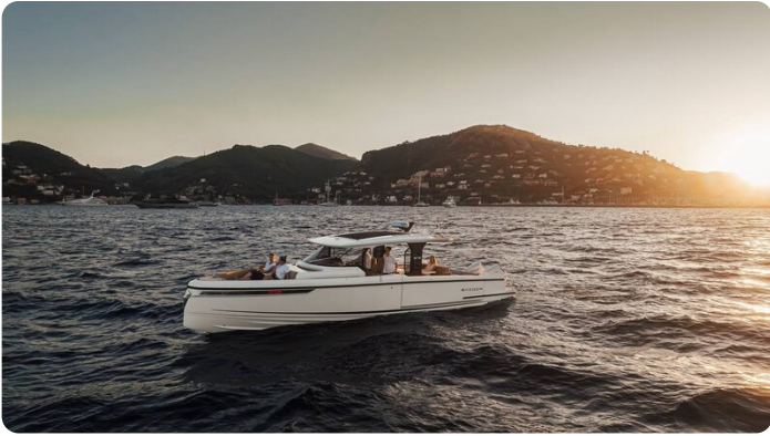
SAXDOR 400 GTS Profile