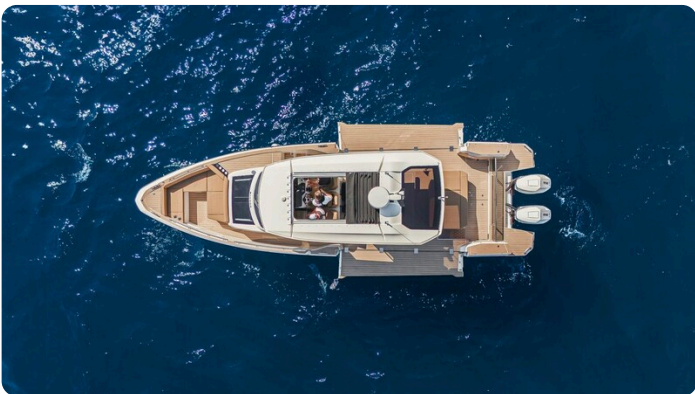
SAXDOR 400 GTS Top view