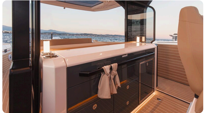
SAXDOR 400 GTS Galley