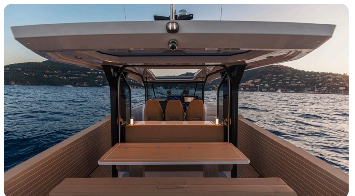
SAXDOR 400 GTS Dinette