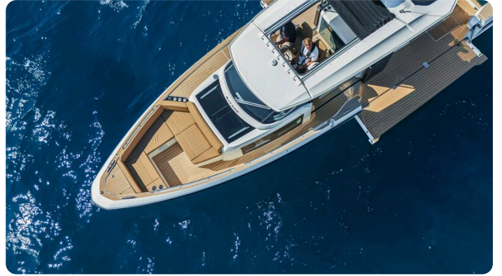
SAXDOR 400 GTS Top detail