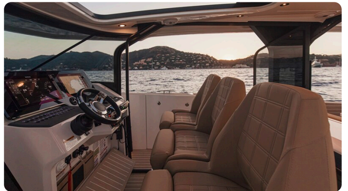
SAXDOR 400 GTS Helm Seats