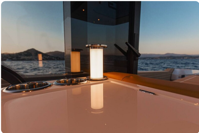
SAXDOR 400 GTS Lights