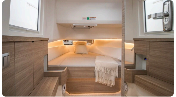
SAXDOR 400 GTS Cabin