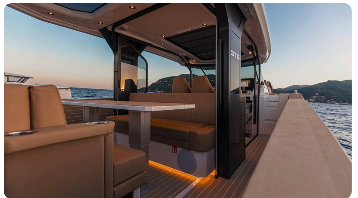
SAXDOR 400 GTS Dinette detail