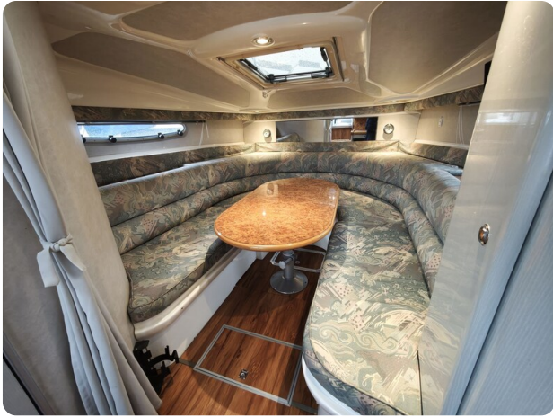
Sealine 28 BELLA 15