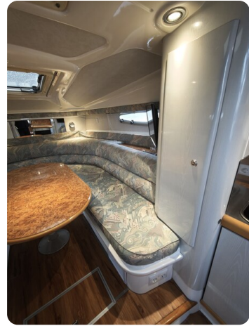
Sealine 28 BELLA 18