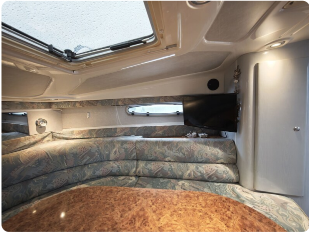
Sealine 28 BELLA 20