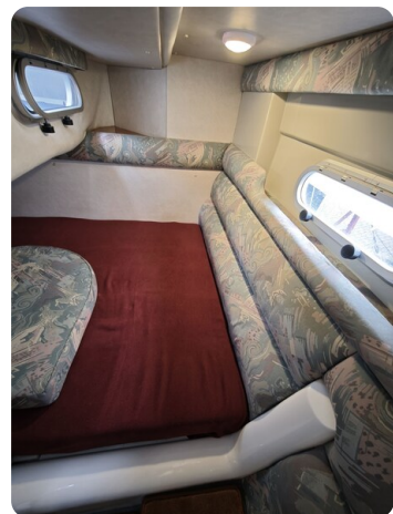
Sealine 28 BELLA 33