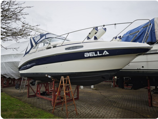
Sealine 28 BELLA 61