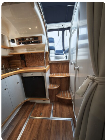
Sealine 28 BELLA 24