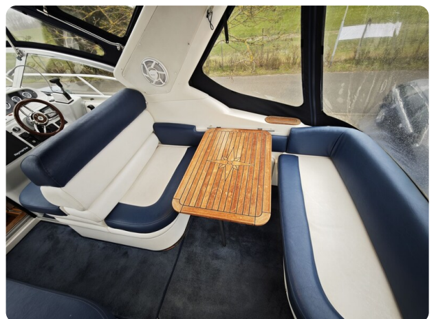
Sealine 28 BELLA 45