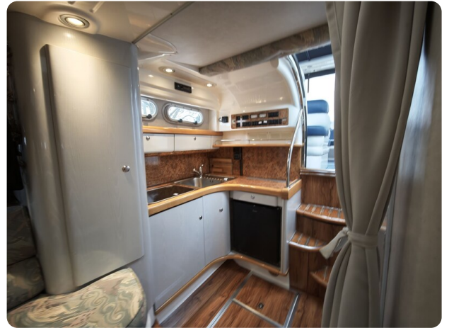
Sealine 28 BELLA 21