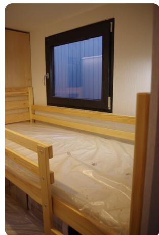
Shogun Hausboot 10m 14