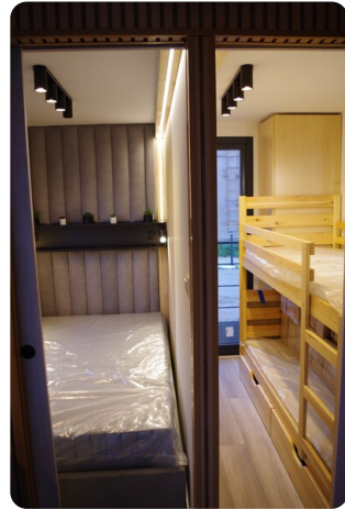
Shogun Hausboot 10m 6