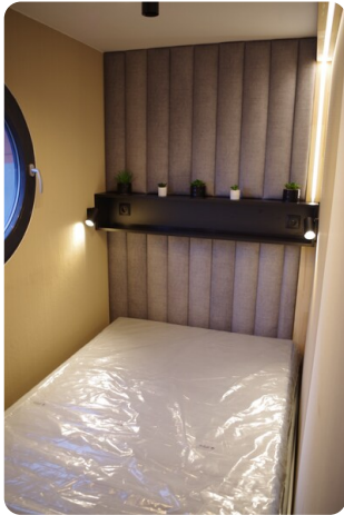
Shogun Hausboot 10m 3