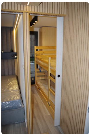
Shogun Hausboot 10m 9