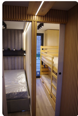
Shogun Hausboot 1000 9