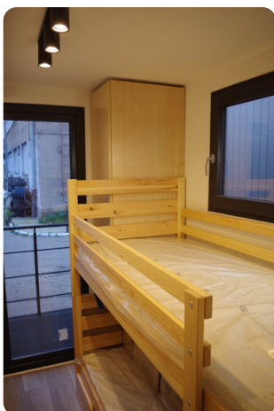
Shogun Hausboot 1000 10