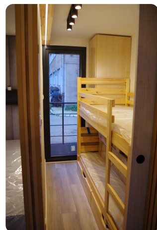
Shogun Hausboot 1000 11