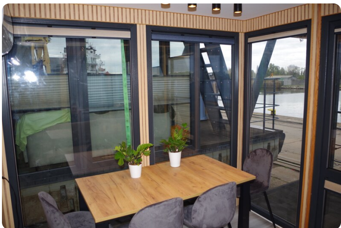
Shogun Hausboot 1000 4