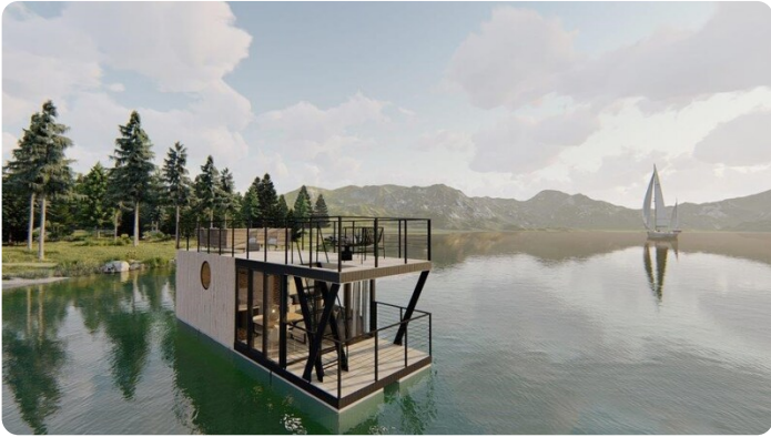
Shogun Hausboot 1000 1