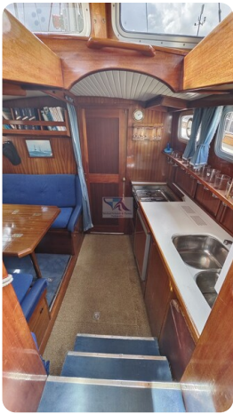
Nauticat 33 NORDSTRAND 40