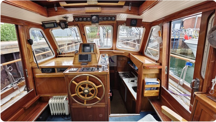
Nauticat 33 NORDSTRAND 59