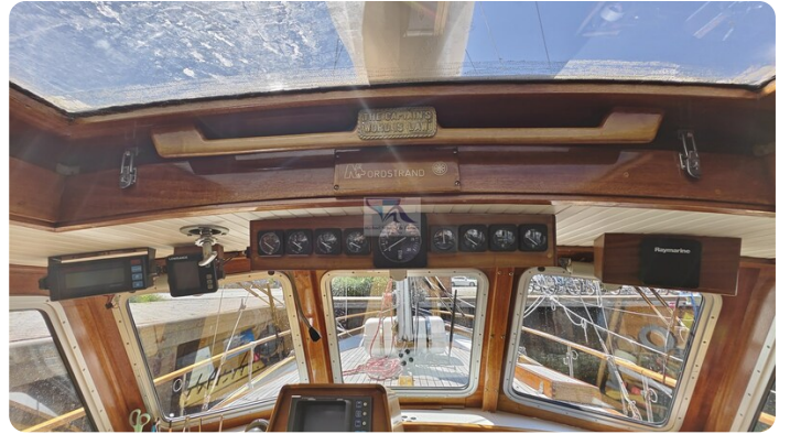
Nauticat 33 NORDSTRAND 27