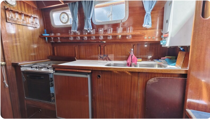
Nauticat 33 NORDSTRAND 47