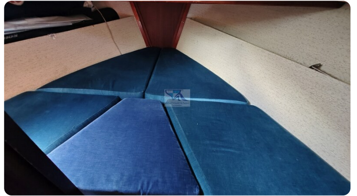
Nauticat 33 NORDSTRAND 36