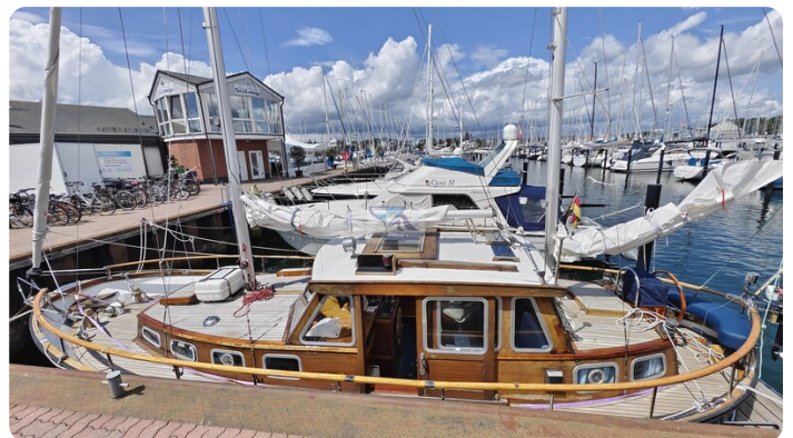
Nauticat 33 NORDSTRAND 10