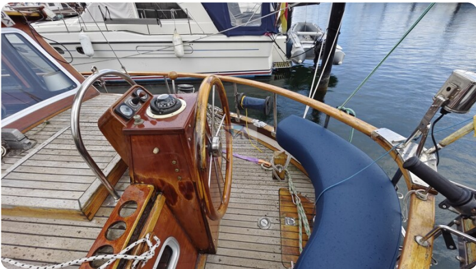
Nauticat 33 NORDSTRAND 76