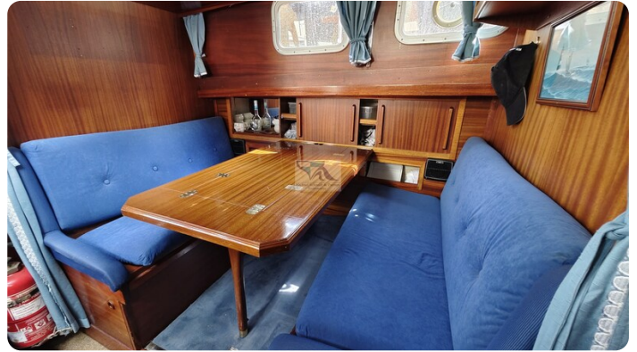
Nauticat 33 NORDSTRAND 45