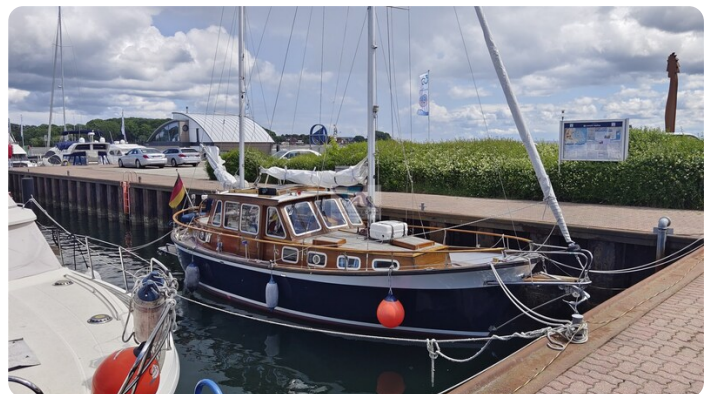
Nauticat 33 NORDSTRAND 3