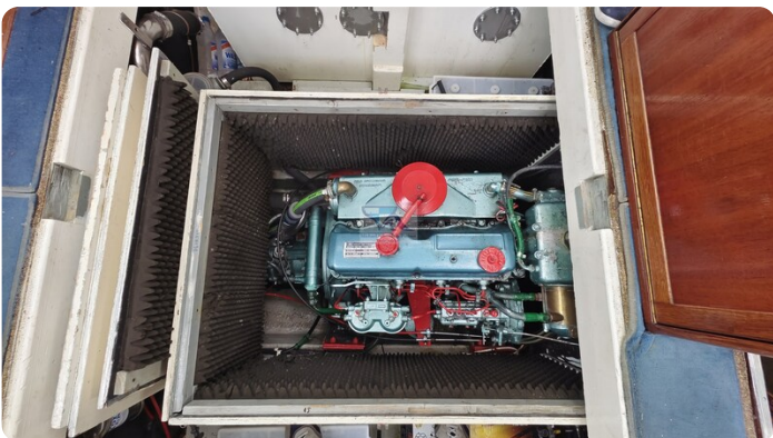
Nauticat 33 NORDSTRAND 1