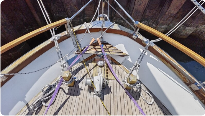
Nauticat 33 NORDSTRAND 13