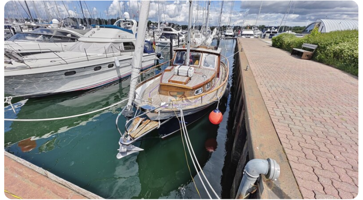
Nauticat 33 NORDSTRAND 6