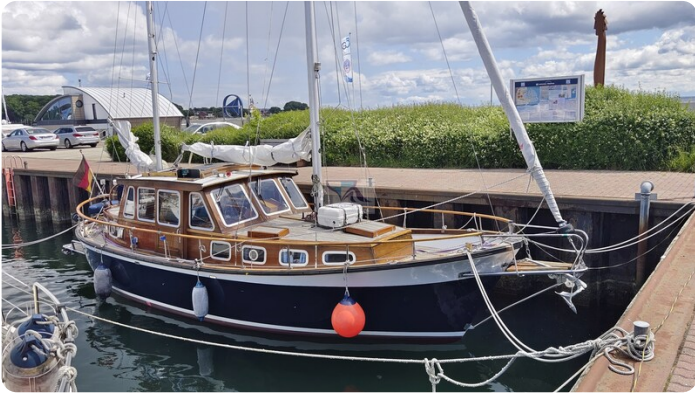
Nauticat 33 NORDSTRAND 2