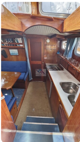
Nauticat 33 NORDSTRAND 40