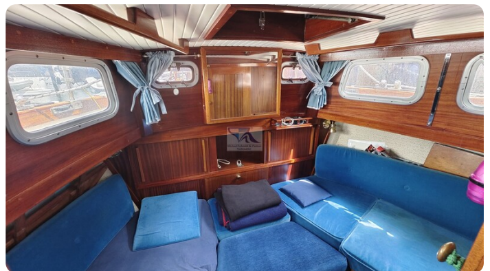
Nauticat 33 NORDSTRAND 57