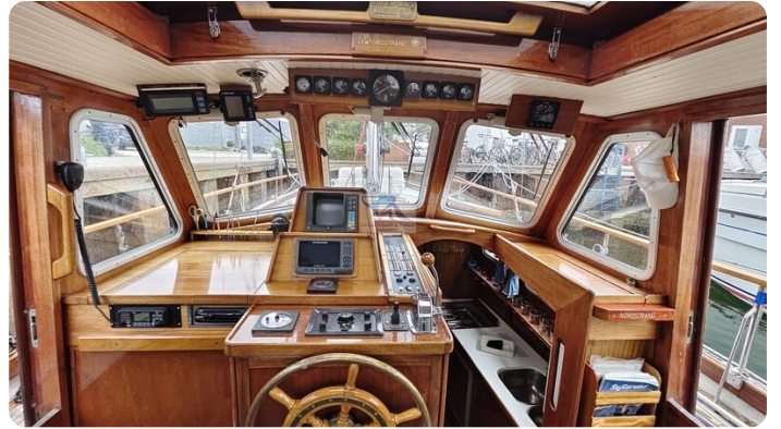
Nauticat 33 NORDSTRAND 60