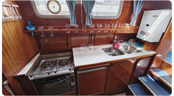
Nauticat 33 NORDSTRAND 51