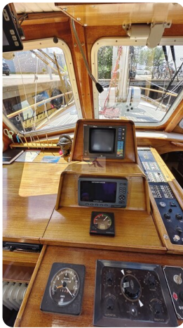
Nauticat 33 NORDSTRAND 31