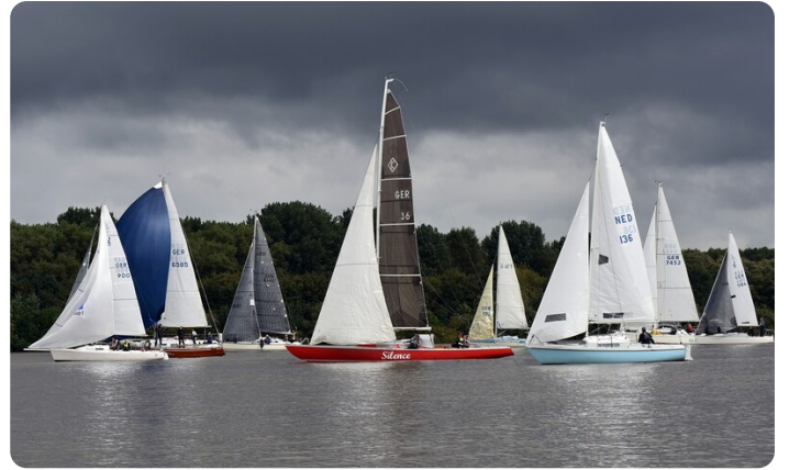
Senatspreis 2021 DSC_7438[17633]