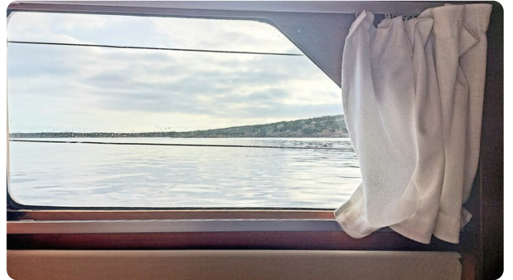
Storebro wc wide side windows