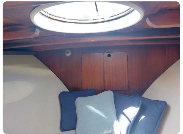
Storebro detail cabin