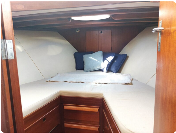
Storebro master cabin