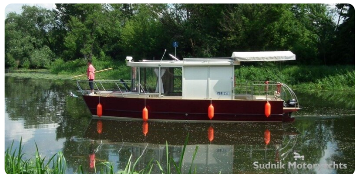
Hausboot SM 30 msp-398859 (22)