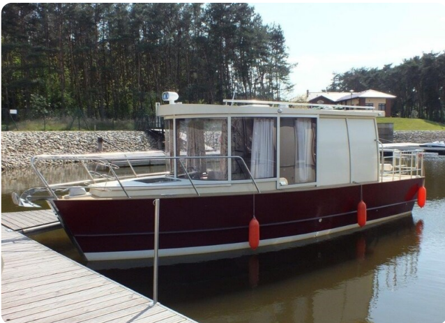
Hausboot SM 30 msp-398859 (23)