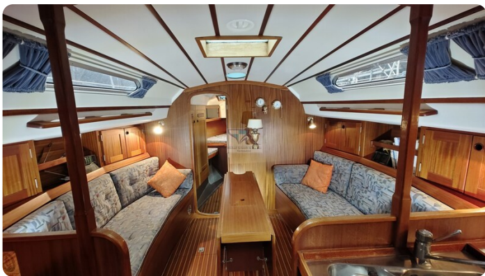
Sweden 340 SPITZMAUS 2