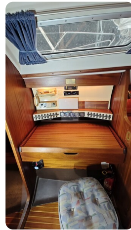
Sweden 340 SPITZMAUS 5