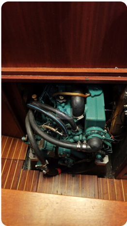
Sweden 340 SPITZMAUS 44