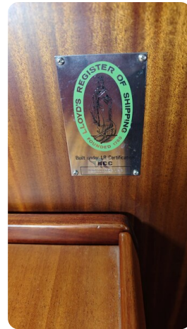
Sweden 340 SPITZMAUS 59