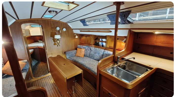
Sweden 340 SPITZMAUS 36