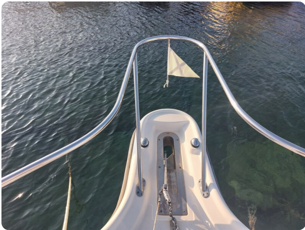
Tiara 3200 Open .jpg