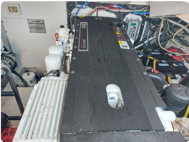
Tiara 3200 Open .jpg