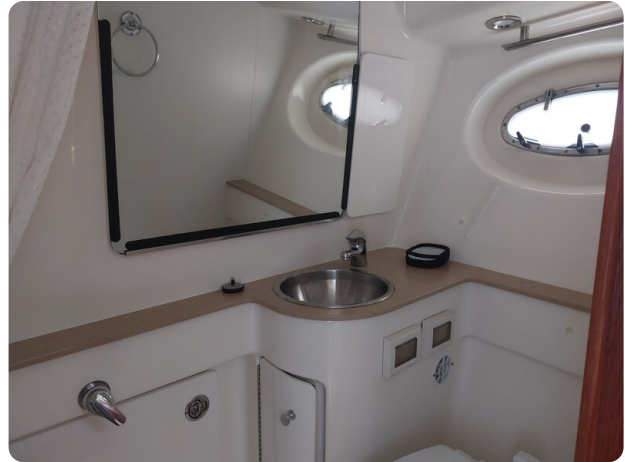
Tiara 3200 Open