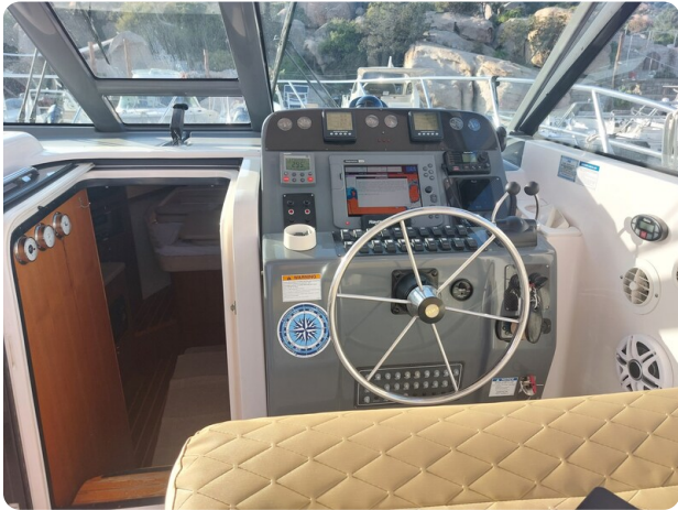
Tiara 3200 Open .jpg