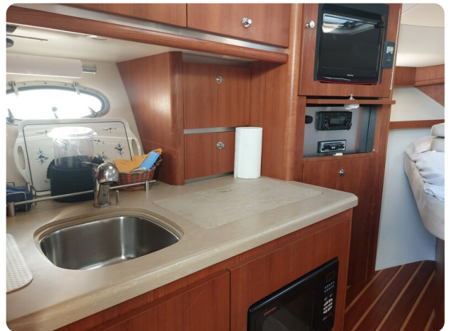
Tiara 3200 Open .jpg