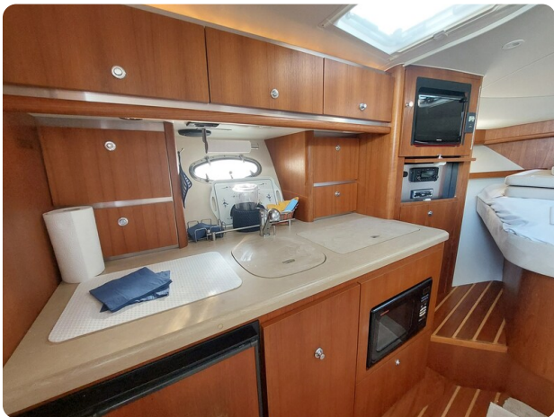
Tiara 3200 Open .jpg