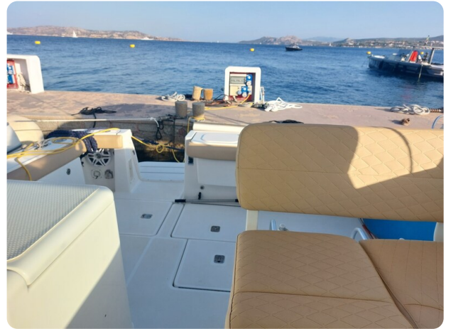
Tiara 3200 Open .jpg