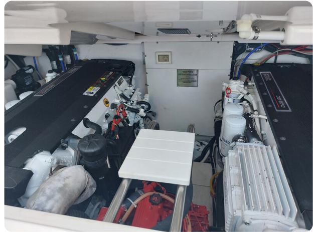
Tiara 3200 Open engines