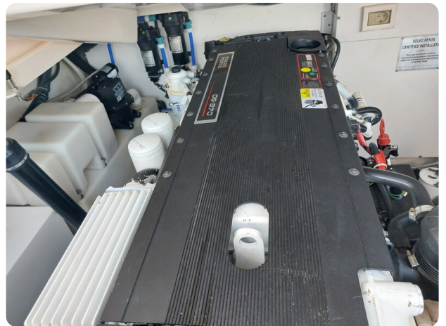
Tiara 3200 Open .jpg