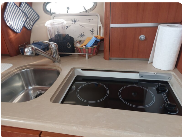
Tiara 3200 Open .jpg