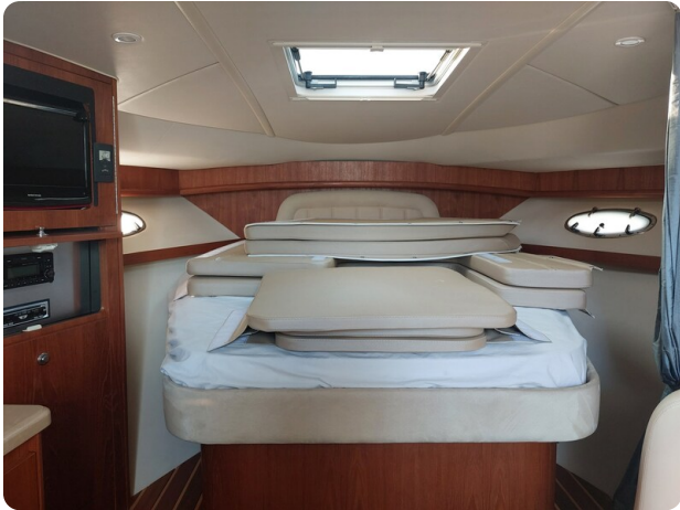
Tiara 3200 Open .jpg