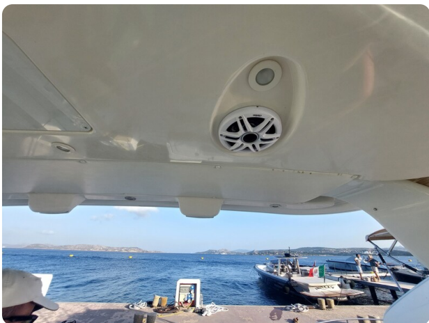
Tiara 3200 Open .jpg