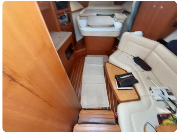
Tiara 3200 Open .jpg