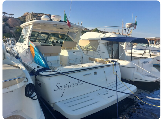
Tiara 3200 Open .jpg