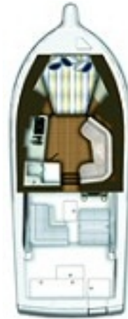
Tiara 3200 Open .jpg