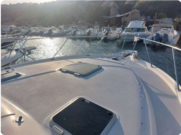
Tiara 3200 Open .jpg