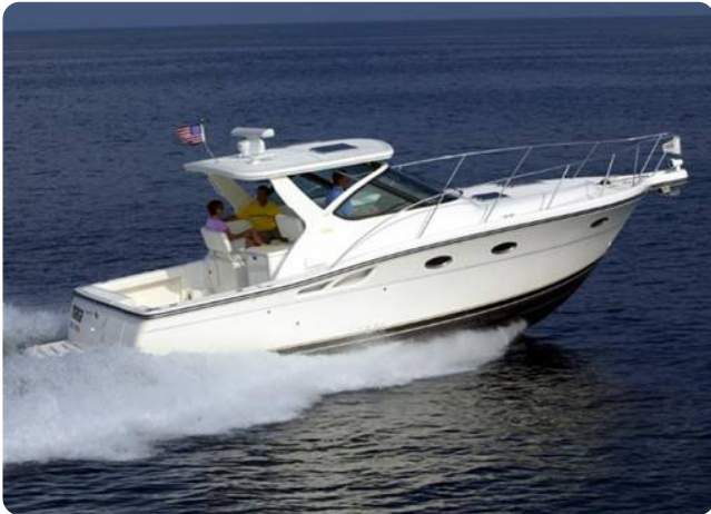
Tiara 3200 Open sistership