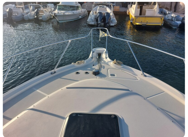
Tiara 3200 Open .jpg