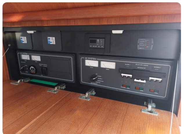
Tiara 3200 Open .jpg