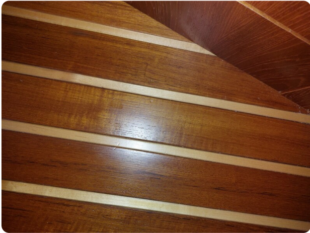
Tiara 3200 Open .jpg