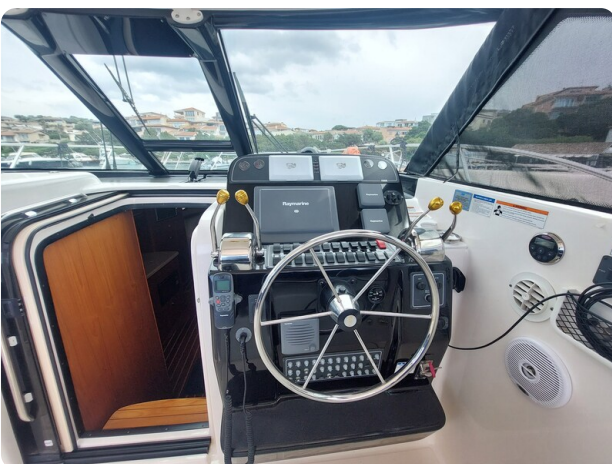
Tiara 3200 Open helm