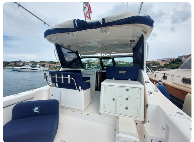
Tiara 3200 Open cockpit view