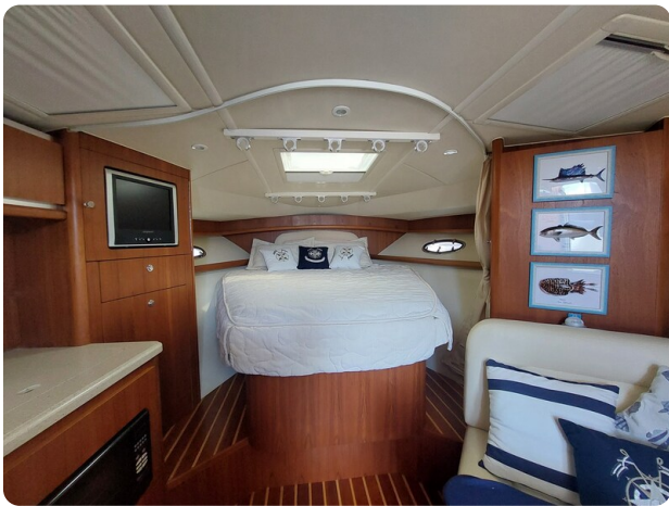
Tiara 3200 Open interiors