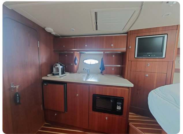
Tiara 3200 Open galley