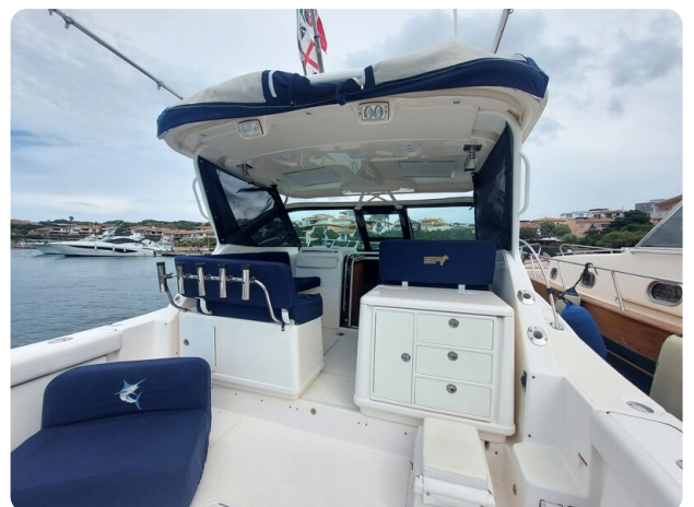
Tiara 3200 Open cockpit view