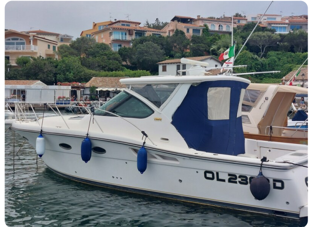
Tiara 3200 Open, aft profile