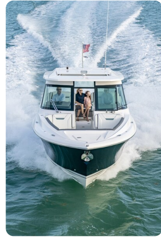
Tiara 34 LX bow