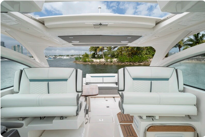
Tiara 34 LX view to aft