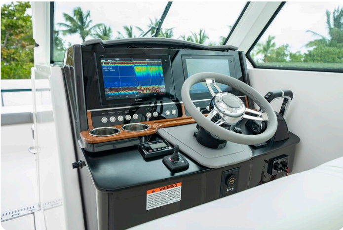
Tiara 34 LX helm