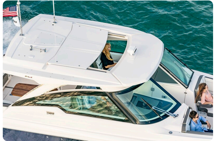
Tiara 34 LX Hard Top