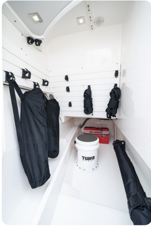
Tiara 34 LX port storage