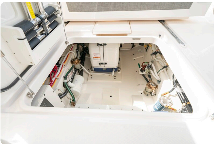
Tiara 34 LX lazarette