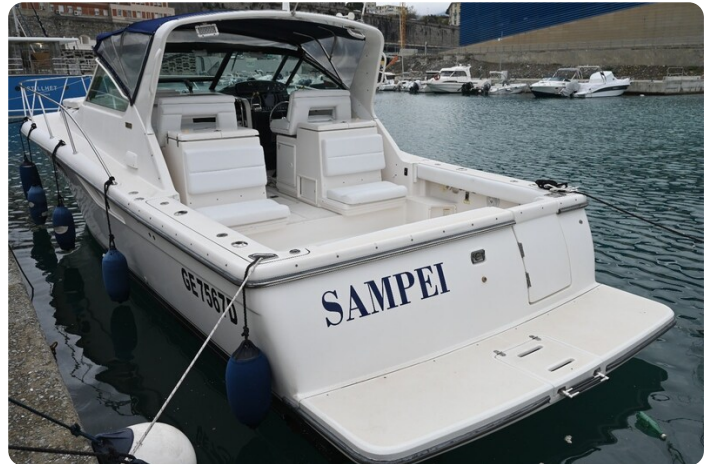
Tiara 3500 Open Sampei aft profile 2