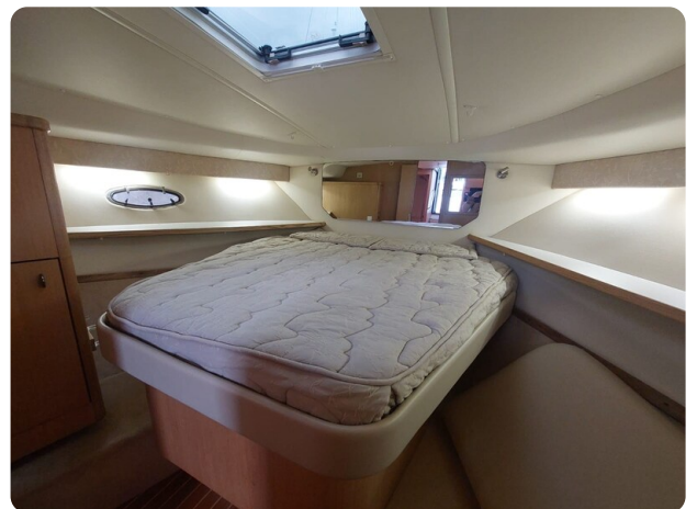
Tiara 3500 Open Sampei cabin