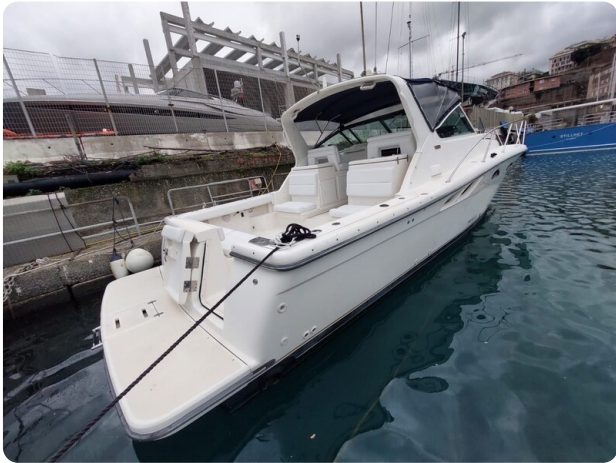
Tiara 3500 Open Sampei aft profile