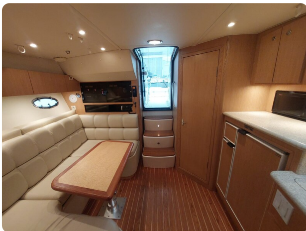
Tiara 3500 Open Sampei cabin view