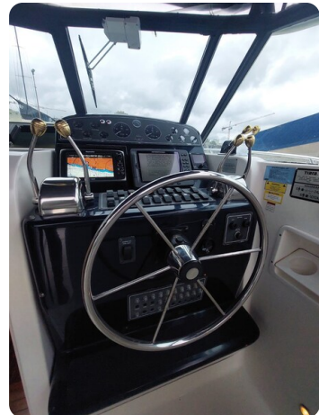
Tiara 3500 Open Sampei helm station