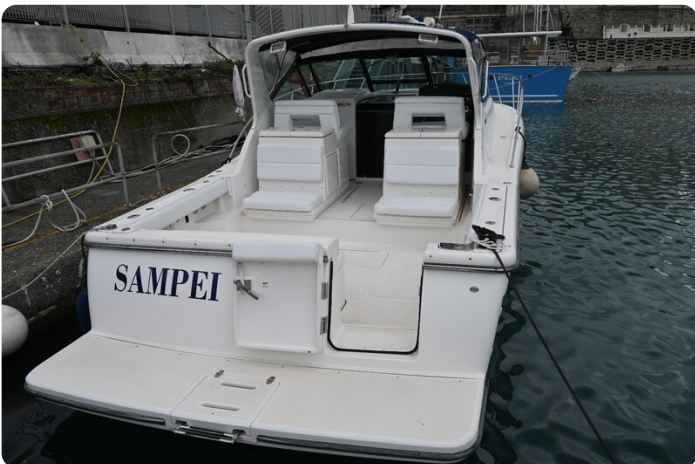
Tiara 3500 Open Sampei stern view