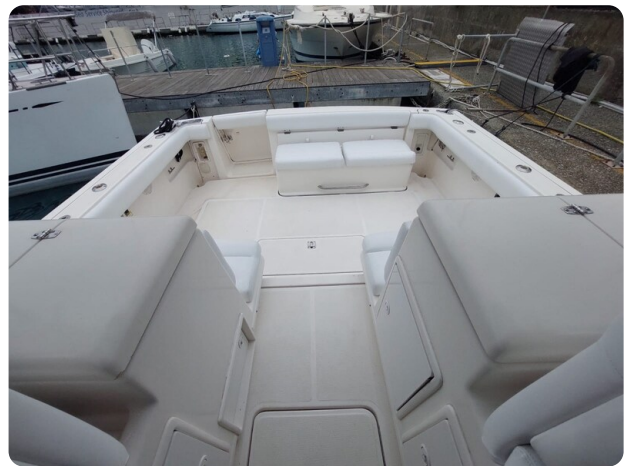
Tiara 3500 Open Sampei cockpit view