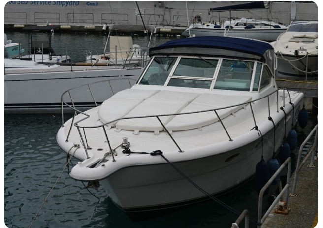
Tiara 3500 Open Sampei bow view