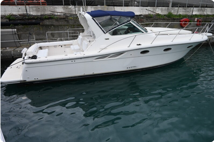
Tiara 3500 Open Sampei profile