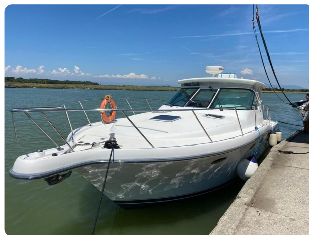
Tiara 3600 Open bow profile