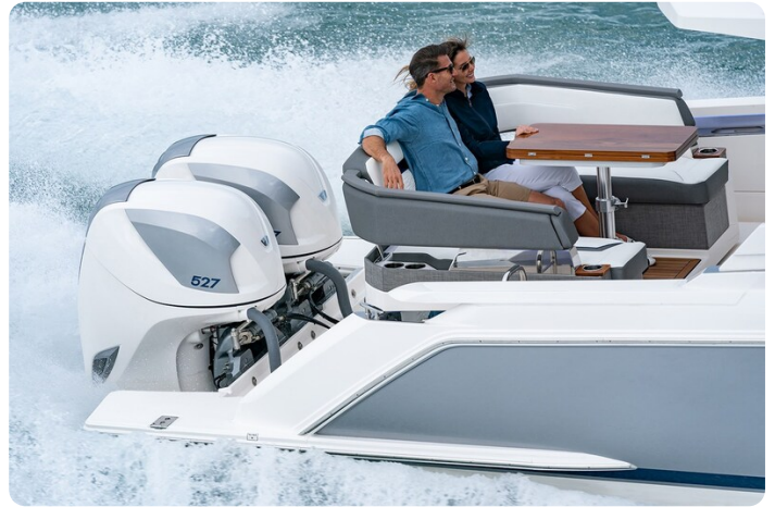
Tiara 38 LS rotating lounge