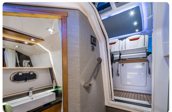
Tiara 38 LS head