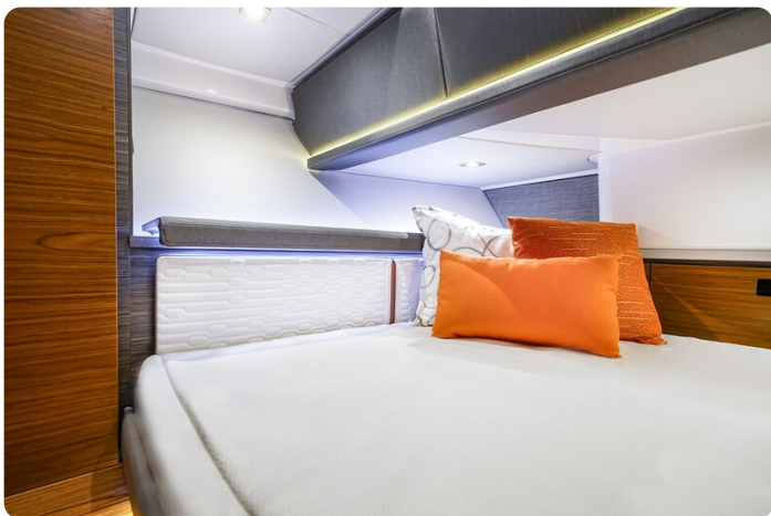
Tiara 38 LS full berth