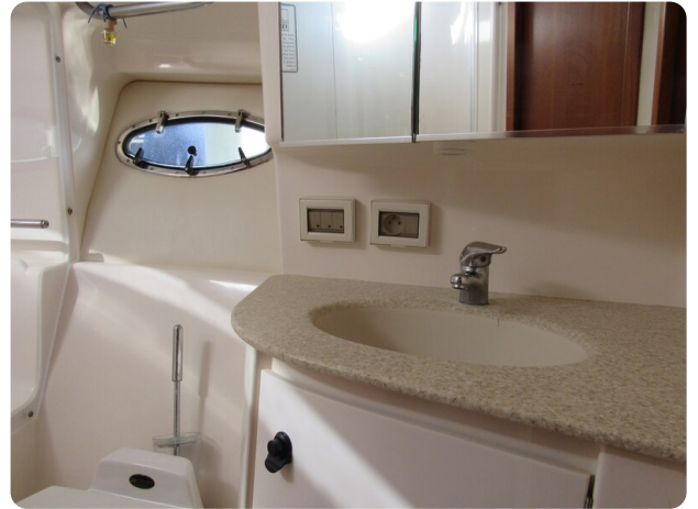
Tiara 3800 Open bathroom