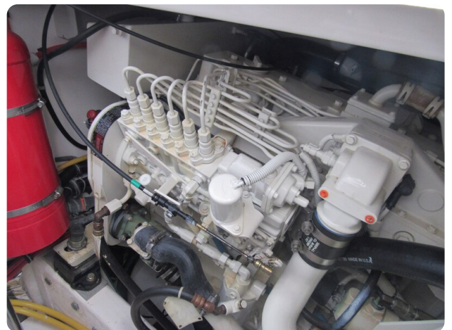
Tiara 3800 Open engine room