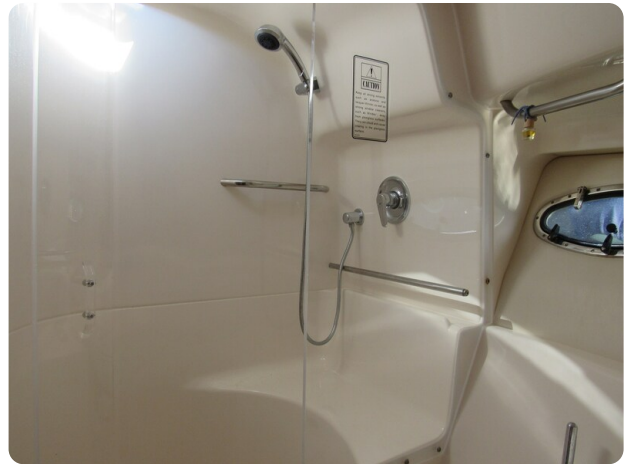
Tiara 3800 Open, shower stall