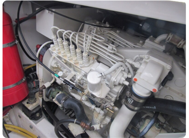
Tiara 3800 Open, engine room