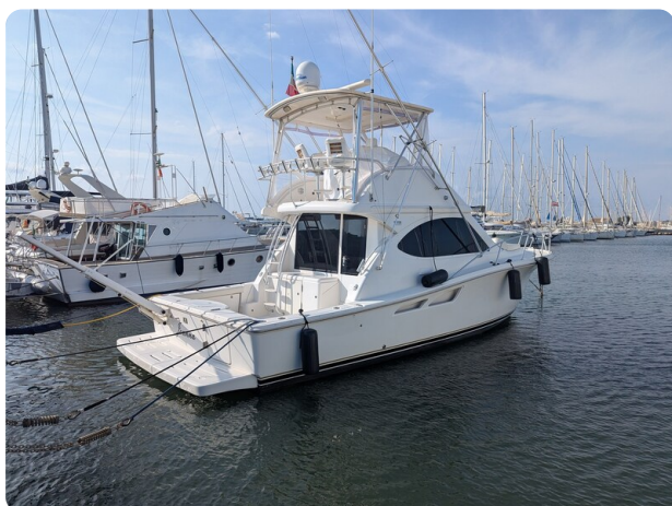
Tiara 3900 Conv. profile