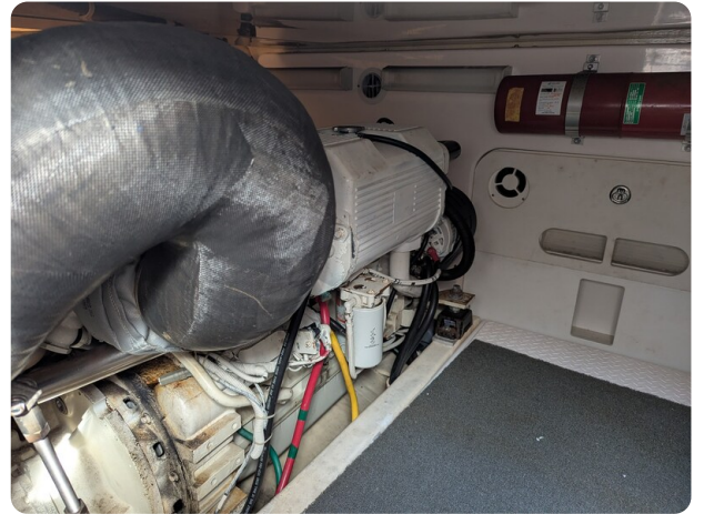
Tiara 3900 Conv. engine details