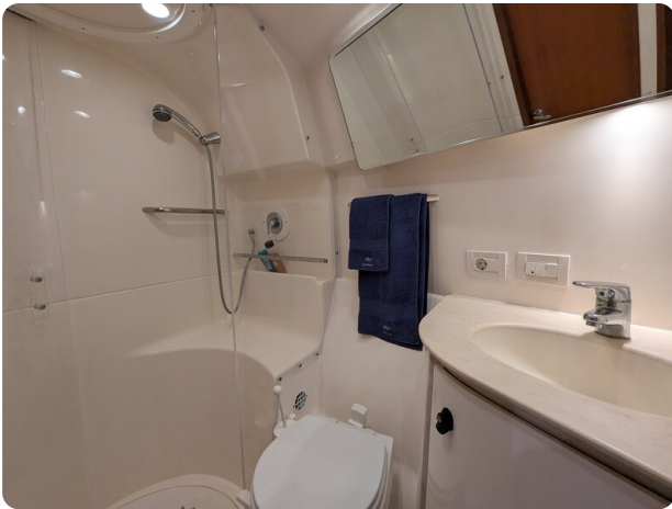
Tiara 3900 Conv. bathroom