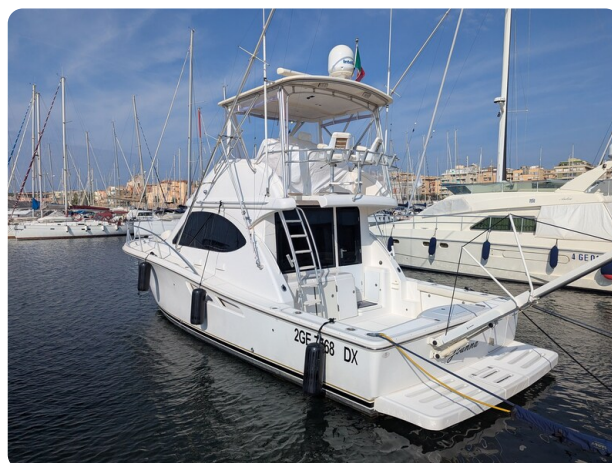
Tiara 3900 Conv. aft profile