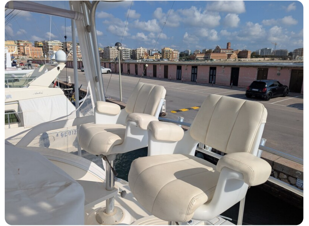
Tiara 3900 Conv. Fly seats