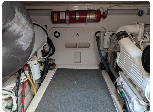
Tiara 3900 Conv. engine room