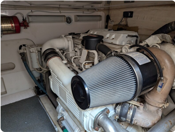
Tiara 3900 Conv. engine detail