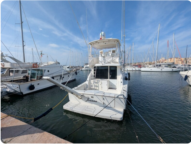
Tiara 3900 Conv. stern view