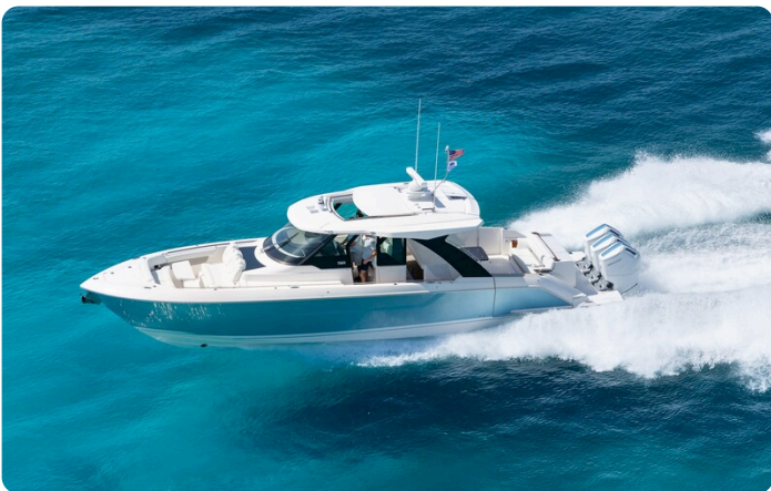
Tiara Yachts 46 LS