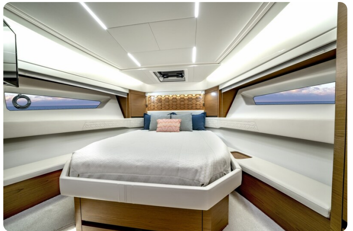
Tiara 48LE master cabin