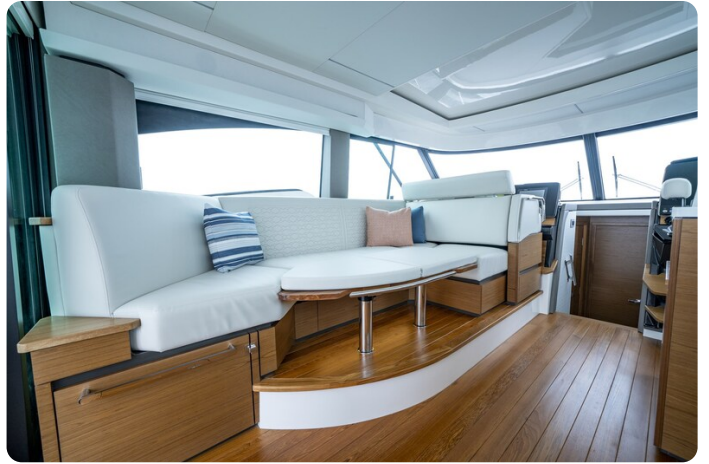
Tiara 48LE dinette