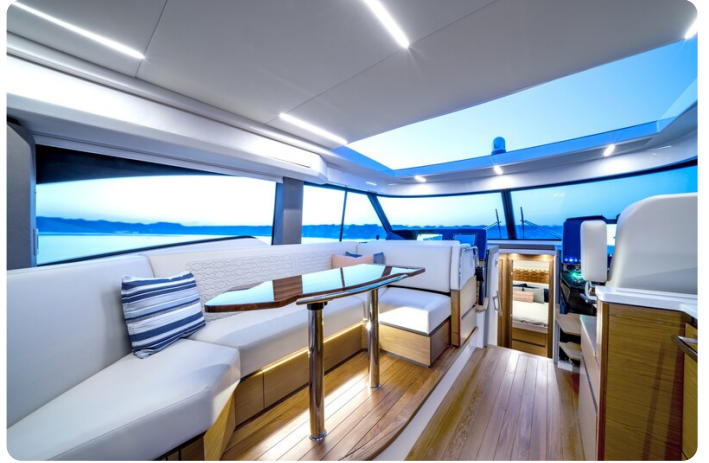
Tiara 48LE salon