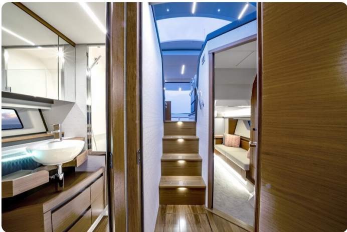
Tiara 48LE interiors