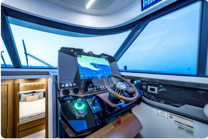
Tiara 48LE helm station