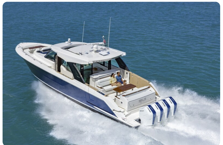
Tiara 56LS running