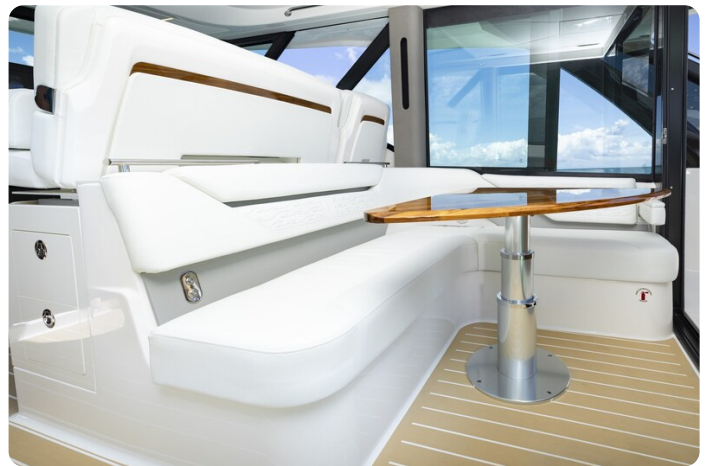
Tiara 56LS dinette detail