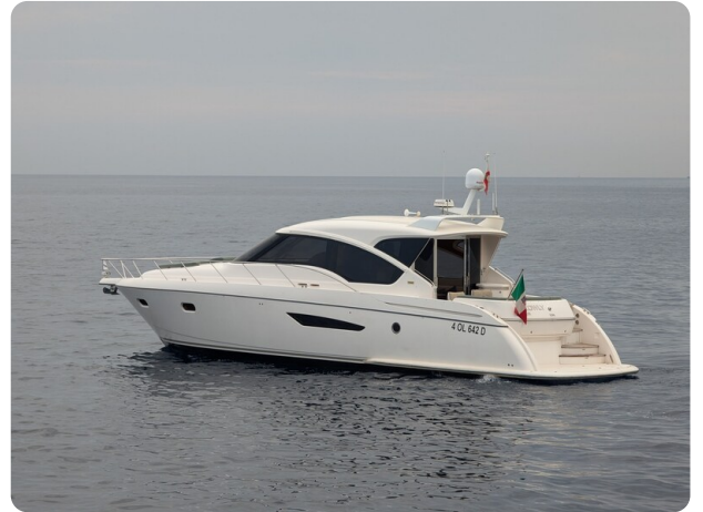
Tiara 5800 Sovran aft profile