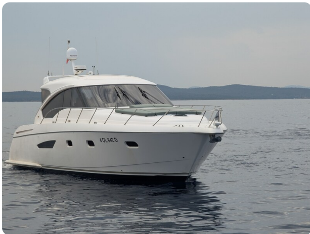
Tiara 5800 Sovran bow view