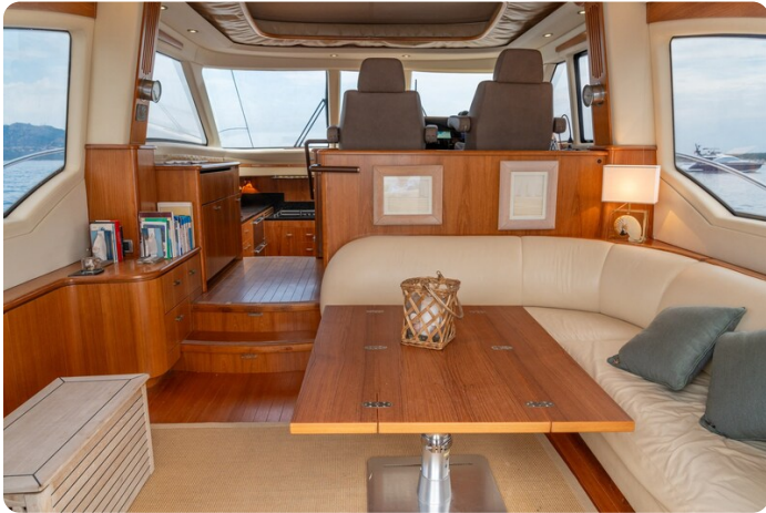
tiara slowly 4-14