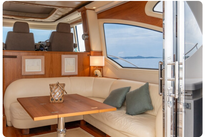
Tiara 5800 Sovran dinette detail