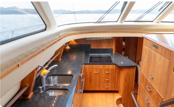
tiara slowly 4-16