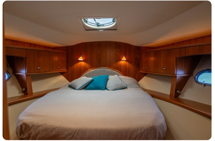
Tiara 5800 Sovran Vip cabin