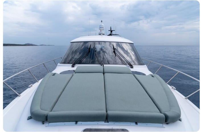
Tiara 5800 Sovran bow deck sunpad