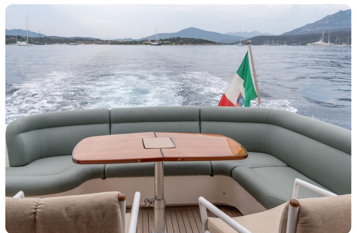
Tiara 5800 Sovran cockpit dinette