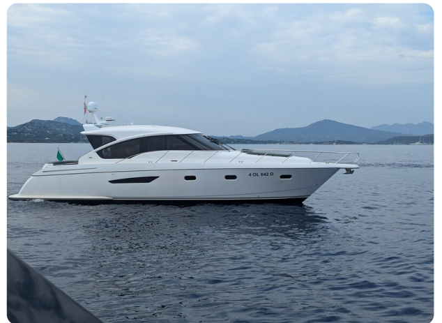
Tiara 5800 Sovran profile