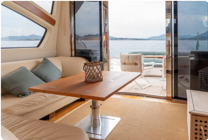
Tiara 5800 Sovran salon view