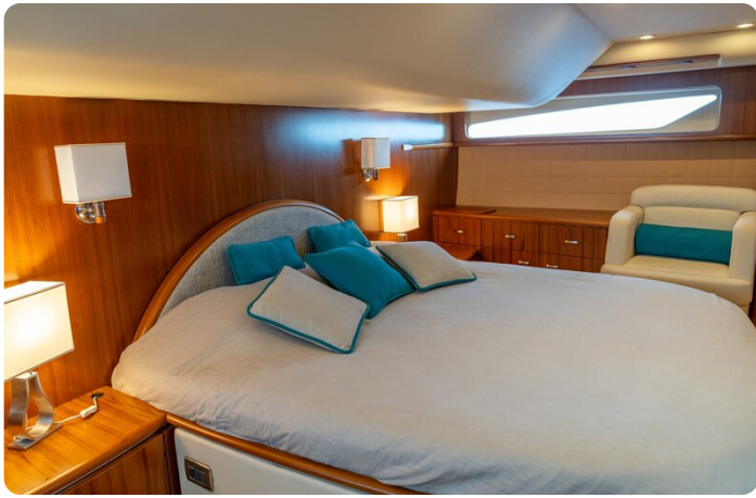
Tiara 5800 Sovran owner's cabin