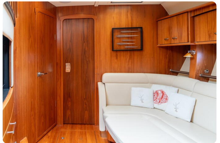
tiara slowly 4-15