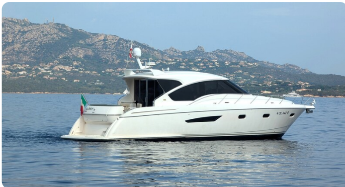
Tiara 5800 Sovran profile