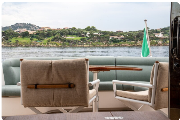
Tiara 5800 Sovran cockpit detail