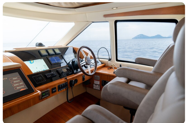
Tiara 5800 Sovran helm station