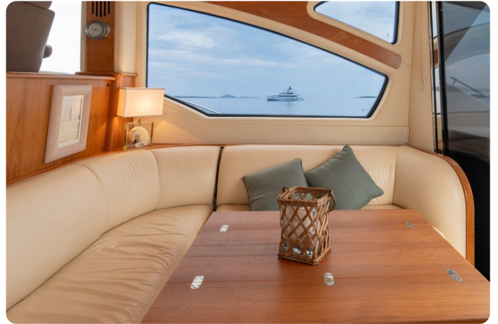
Tiara 5800 Sovran dinette