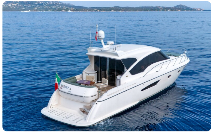
Tiara 5800 Sovran stern view