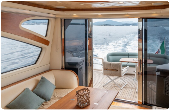
Tiara 5800 Sovran salon to aft