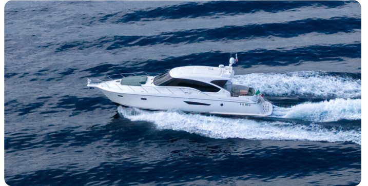
Tiara 5800 Sovran running