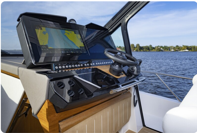
Tiara EX54 helm station