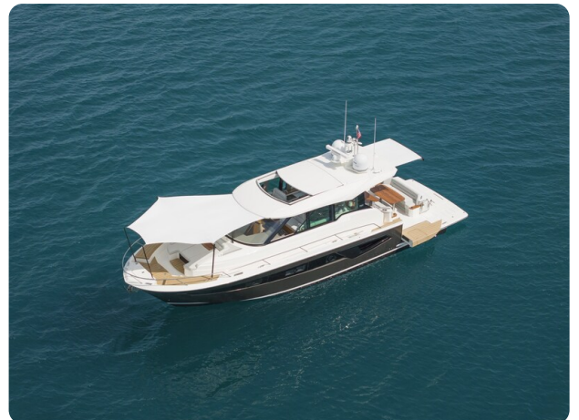
Tiara EX54 anchored