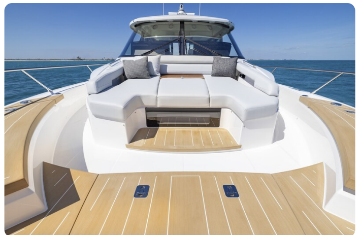
Tiara EX54 bow deck