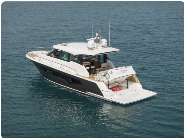
Tiara EX54 aft view