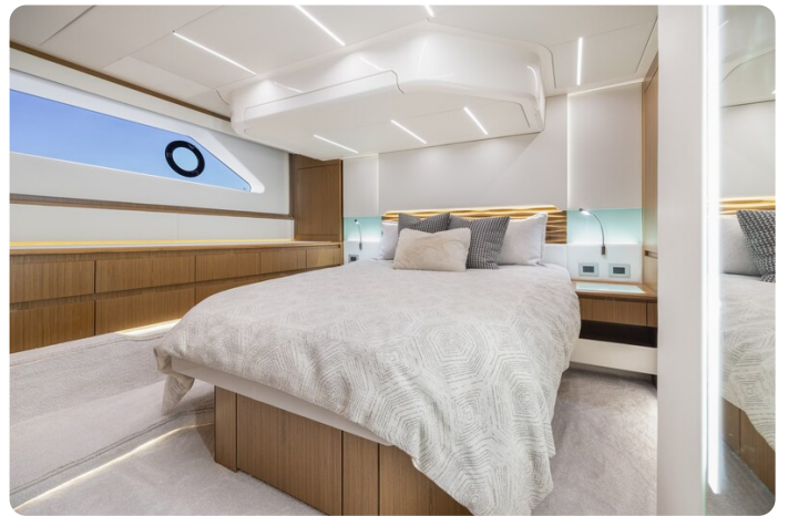
Tiara EX54 owner's cabin