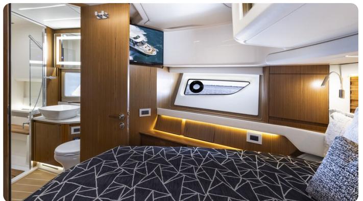
Tiara EX54 VIP cabin detail