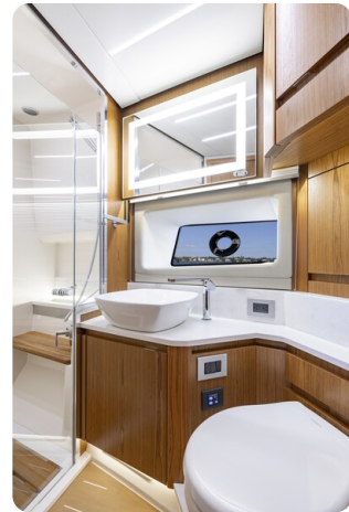
Tiara EX54 bathroom