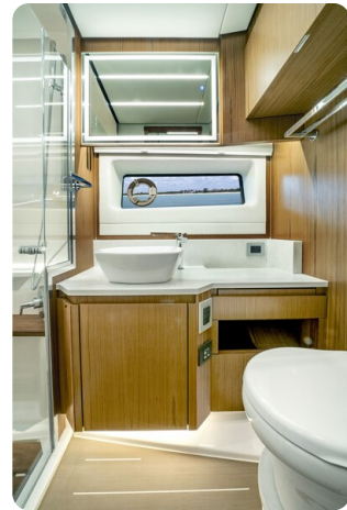
Tiara EX60 bathroom