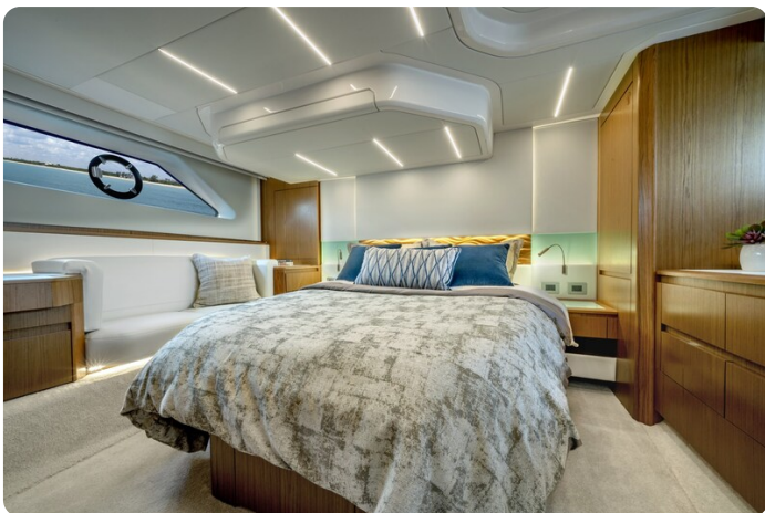
Tiara EX60 owner's cabin