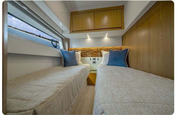
Tiara EX60 guest cabin