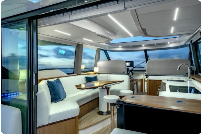
Tiara EX60 salon view