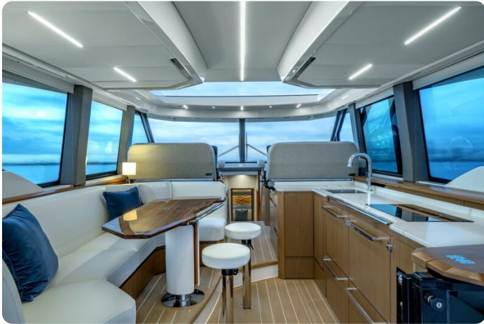
Tiara EX60 salon