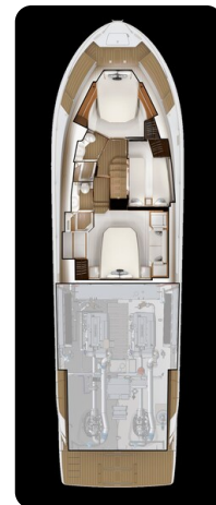
Tiara EX 60 lower layout