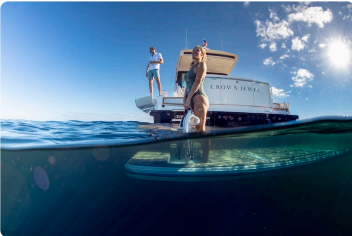
Tiara EX60 lifestyle