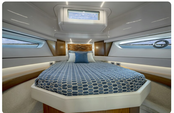
Tiara EX60 Vip cabin