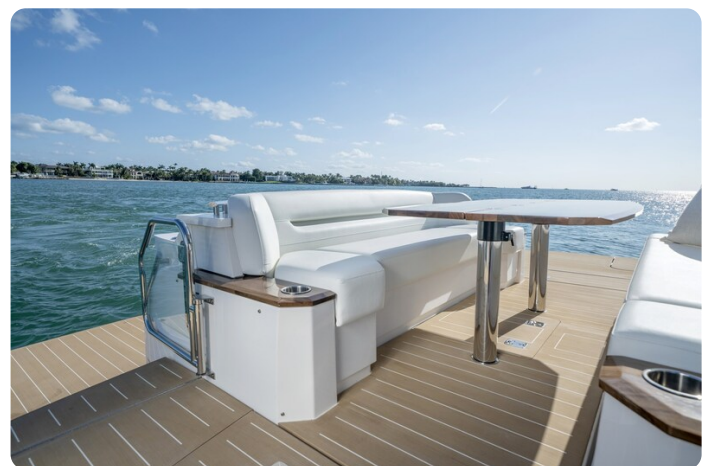
Tiara EX60 aft lounge