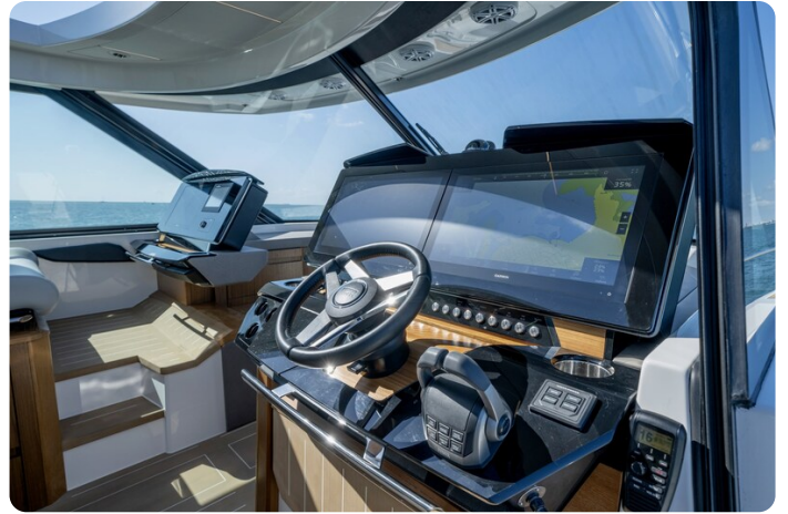
Tiara EX60 helm