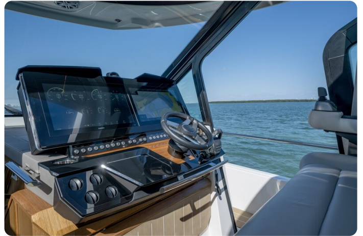
Tiara EX60 helm station