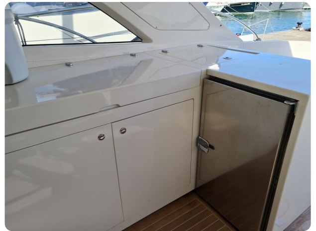
Toy Tender 47, galley