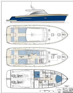
Toy Tender LAYOUT TT03