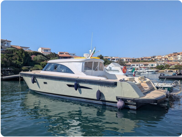
Toy Tender 47 profile