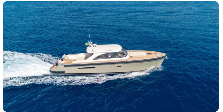
Toy Tender cruising