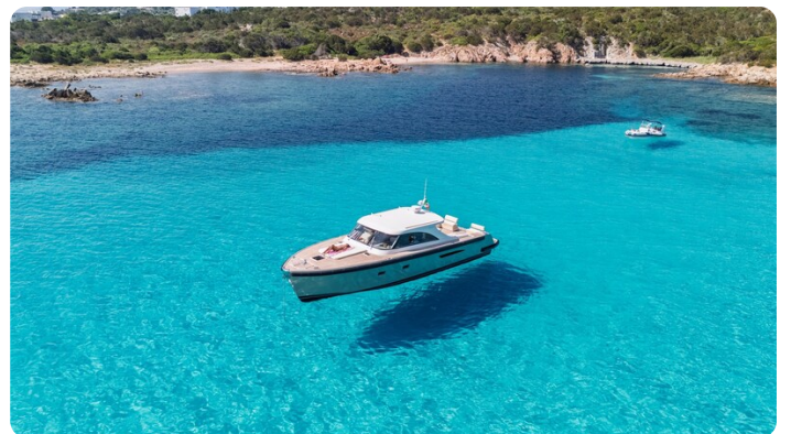
Toy Tender aerial view