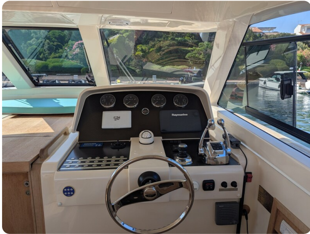
Toy Tender 47 helm