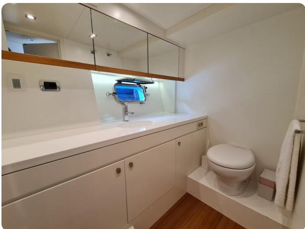
Toy Tender 47, bathroom