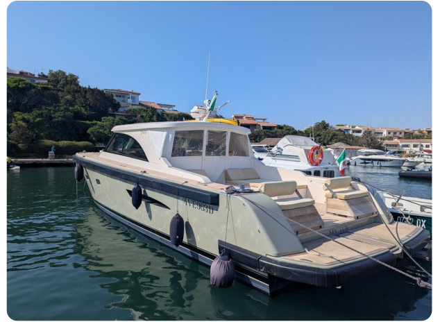
Toy Tender 47 aft profile