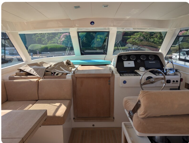
Toy Tender 47 helm station view