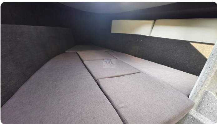
Voyager 700 Cabin_51