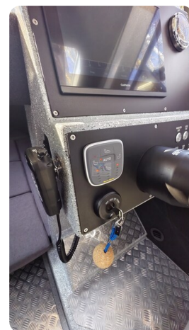
Voyager 700 Cabin_42