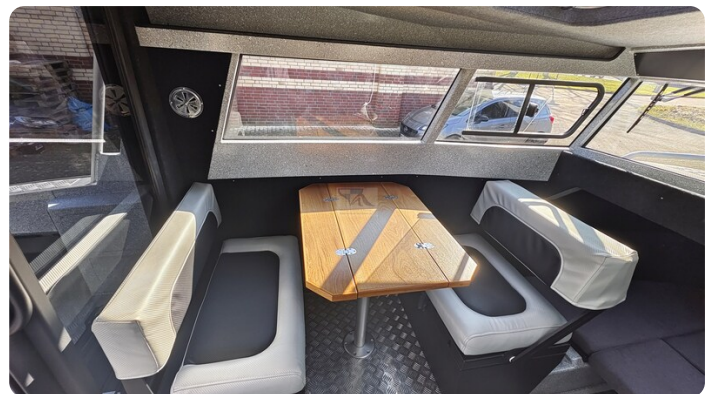
Voyager 700 Cabin_37