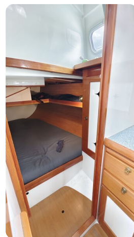
Helena 35 23