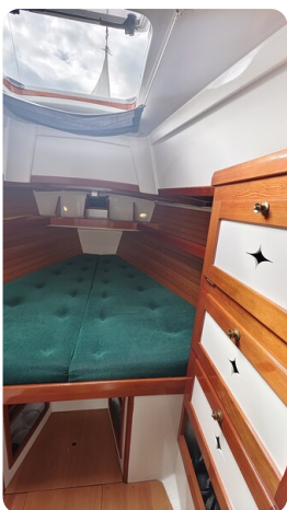
Helena 35 4