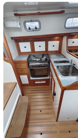
Helena 35 21