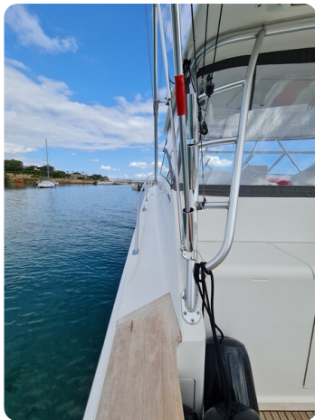
Viking 45 Open, detail