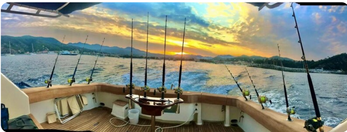
Viking 54 fishing