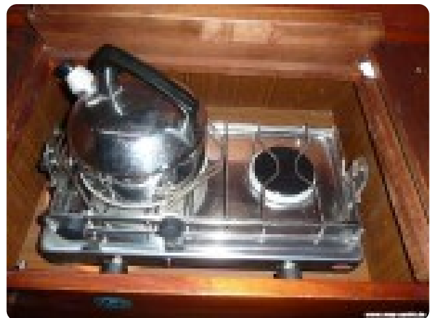
Vindö 50 msp269542 5