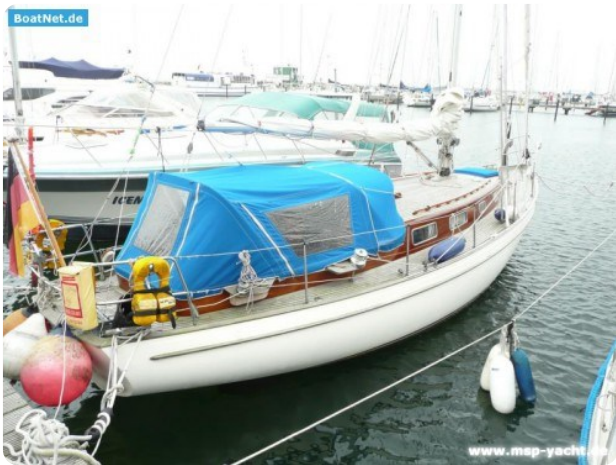
Vindö 50 msp269542 1