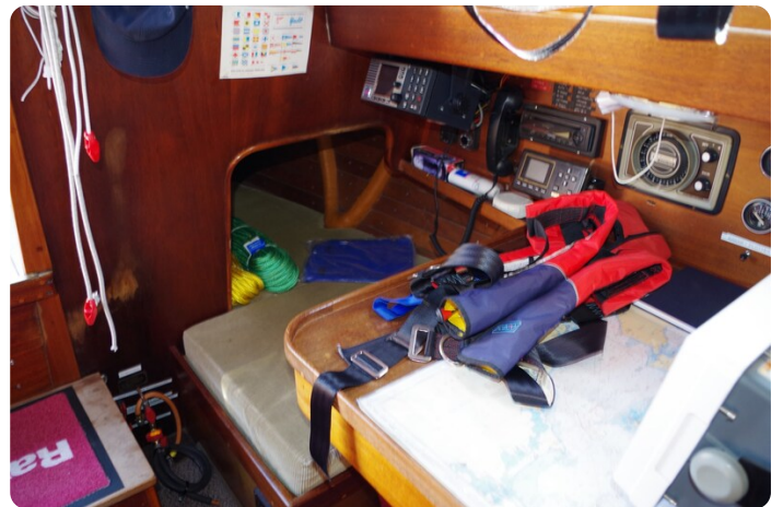
Vindö 50 msp269542 15