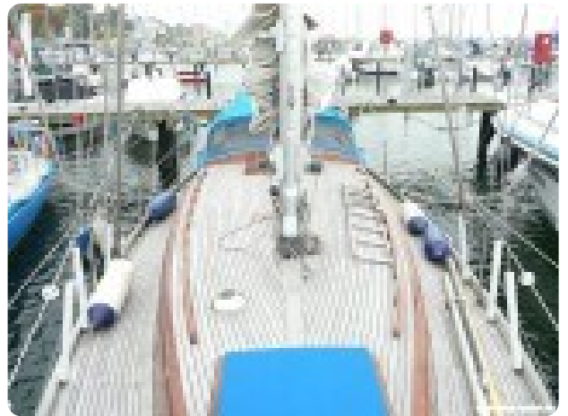
Vindö 50 msp269542 2