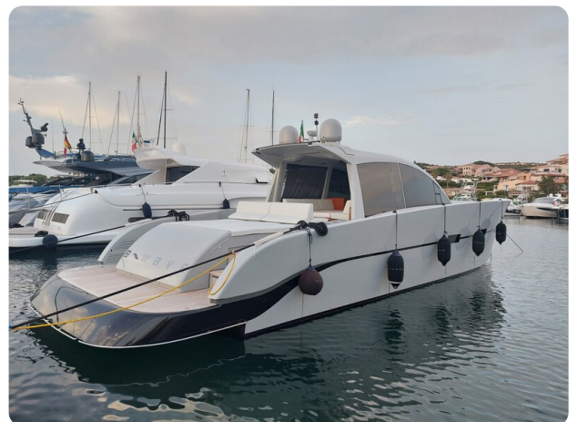
Vismara Bwave profile3