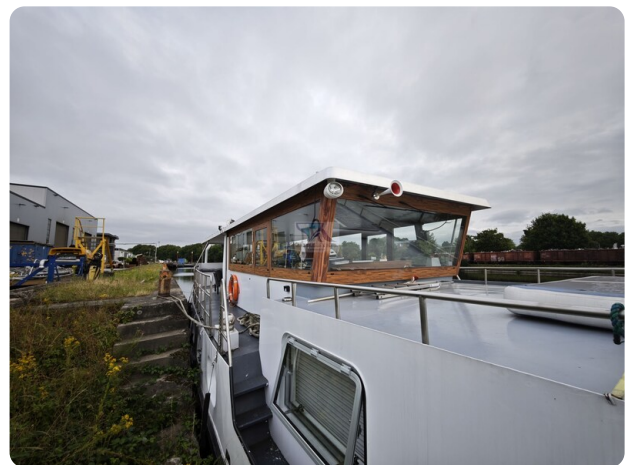
MY GINO 18