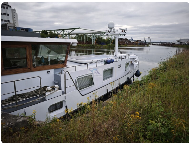
MY GINO 2