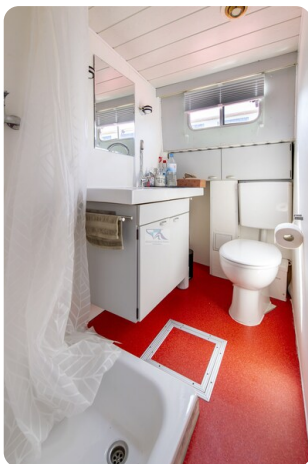
15m Stahlmotoryacht BERDA 11