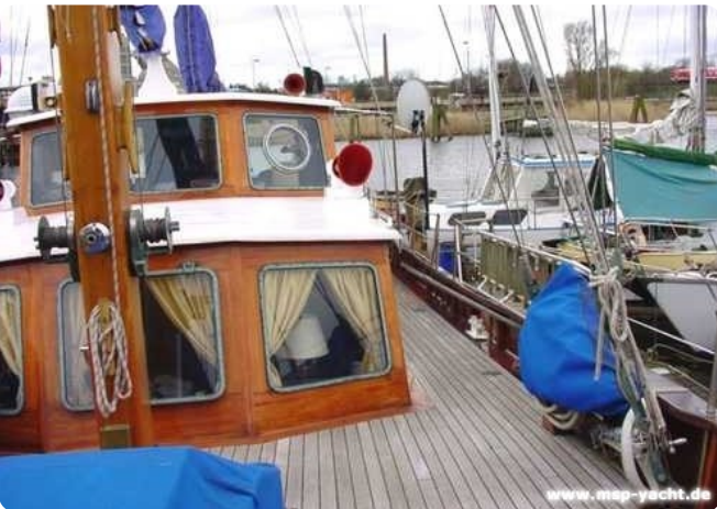
Lühsen Kutteryacht 21,50m msp256650 2