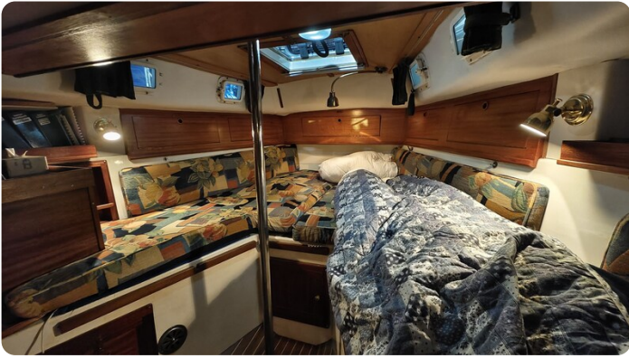
Westerly 36 Conway ANTIALOCHE 37