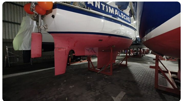
Westerly 36 Conway ANTIMALOCHE 71