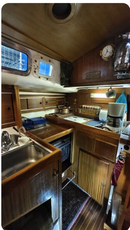
Westerly 36 Conway ANTIALOCHE 12