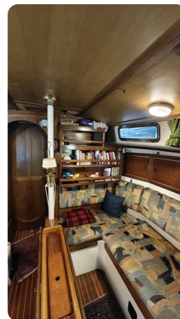
Westerly 36 Conway ANTIALOCHE 14