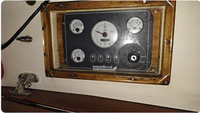
Westerly 36 Conway ANTIALOCHE 67