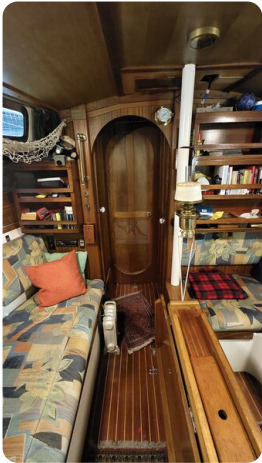
Westerly 36 Conway ANTIMALOCHE 20