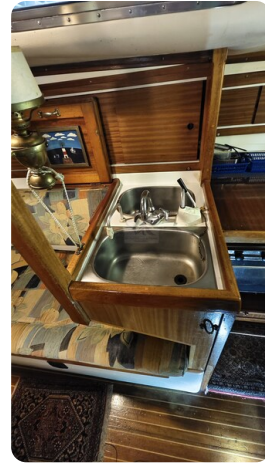
Westerly 36 Conway ANTIMALOCHE 16