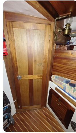
Westerly 36 Conway ANTIALOCHE 46