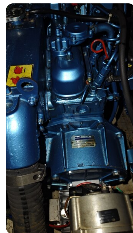
Westerly 36 Conway ANTIALOCHE 40