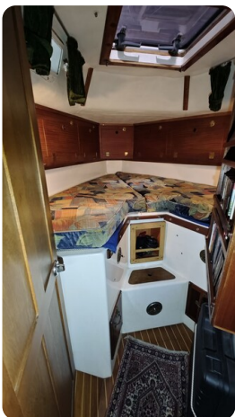
Westerly 36 Conway ANTIMALOCHE 24