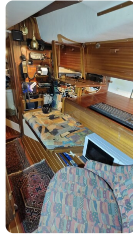
Westerly 36 Conway ANTIALOCHE 34