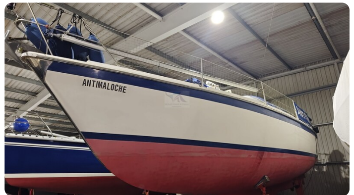
Westerly 36 Conway ANTIMALOCHE 79