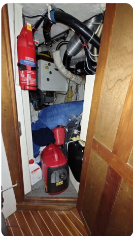
Westerly 36 Conway ANTIALOCHE 45