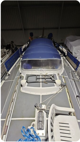
Westerly 36 Conway ANTIALOCHE 50