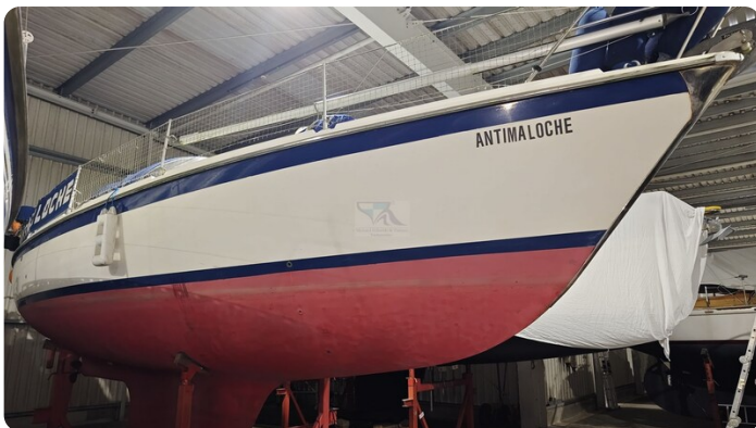
Westerly 36 Conway ANTIMALOCHE 78