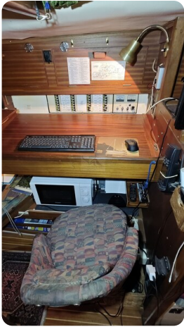
Westerly 36 Conway ANTIALOCHE 31