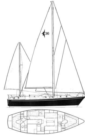
W36 Conway Layout