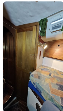
Westerly 36 Conway ANTIMALOCHE 28