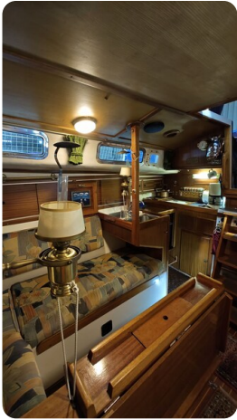
Westerly 36 Conway ANTIMALOCHE 15