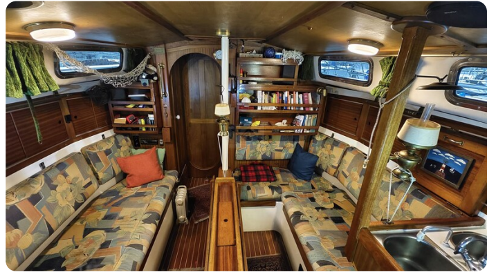
Westerly 36 Conway ANTIALOCHE 10