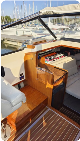
Windy 25 MIRAGE msp790159 38