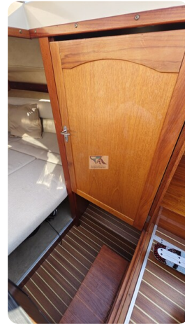
Windy 25 MIRAGE msp790159 26