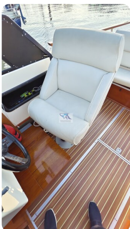
Windy 25 MIRAGE msp790159 50