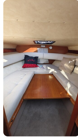
Windy 25 MIRAGE msp790159 33