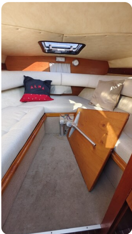
Windy 25 MIRAGE msp790159 34