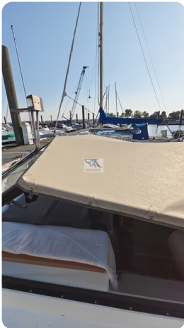
Windy 25 MIRAGE msp790159 10