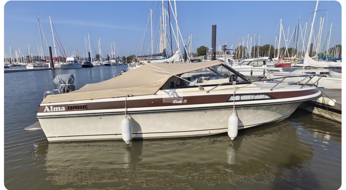
Windy 25 MIRAGE msp790159 7