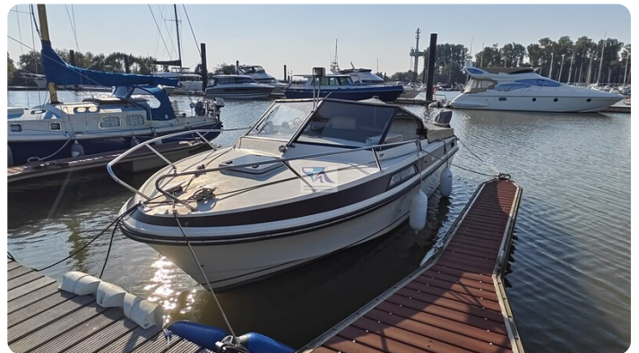
Windy 25 MIRAGE msp790159 4