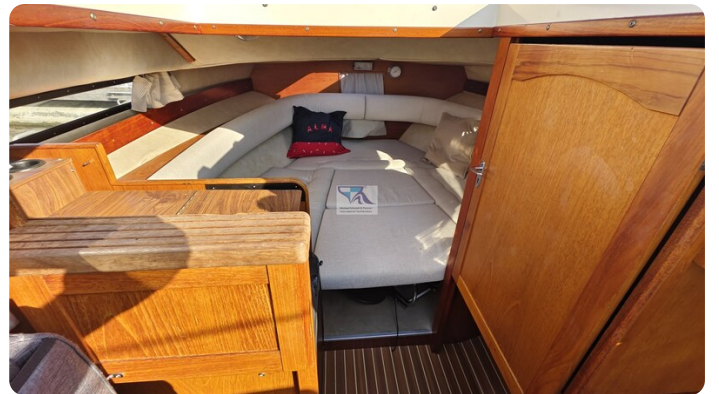
Windy 25 MIRAGE msp790159 21