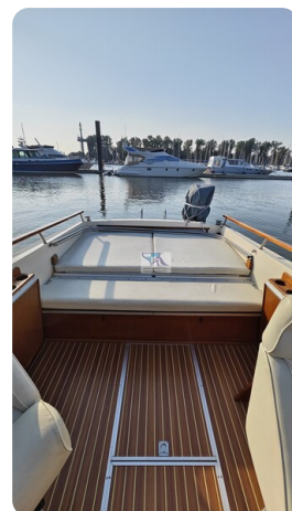
Windy 25 MIRAGE msp790159 42