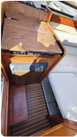
Windy 25 MIRAGE msp790159 27