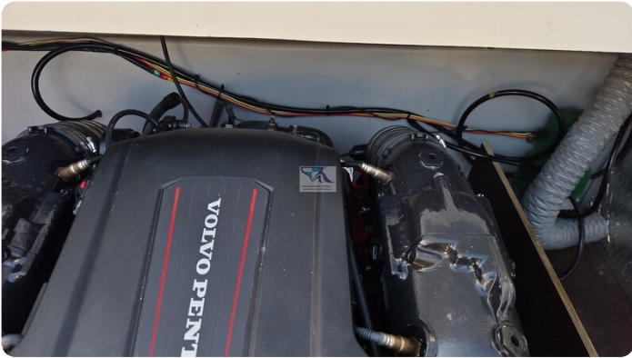
Windy 25 MIRAGE msp790159 56