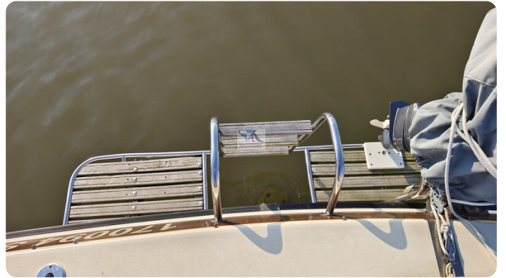
Windy 25 MIRAGE msp790159 57