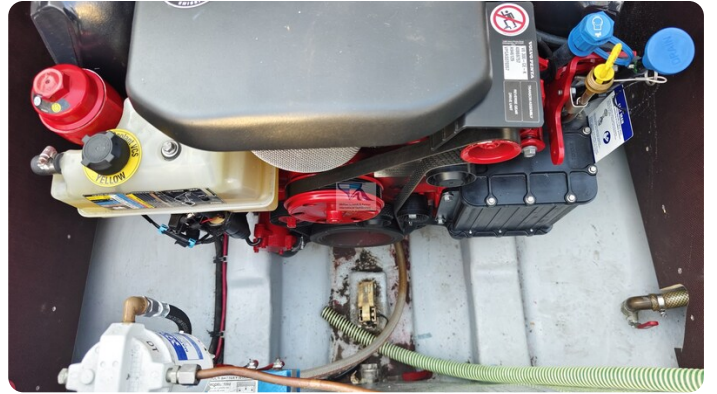
Windy 25 MIRAGE msp790159 53