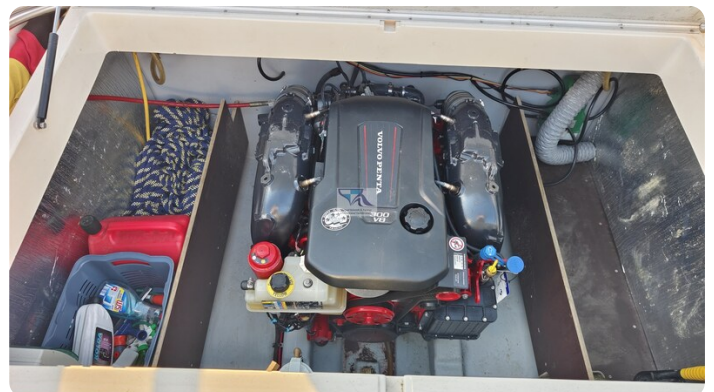
Windy 25 MIRAGE msp790159 51