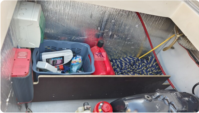
Windy 25 MIRAGE msp790159 52