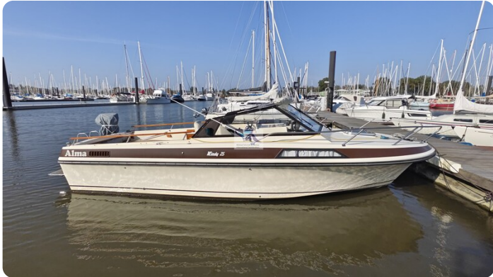
Windy 25 MIRAGE msp790159 15