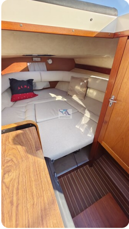
Windy 25 MIRAGE msp790159 24