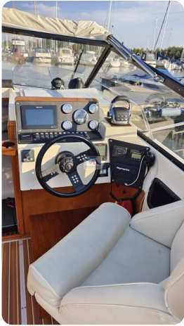
Windy 25 MIRAGE msp790159 35