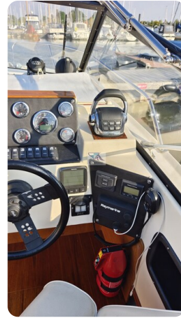
Windy 25 MIRAGE msp790159 37