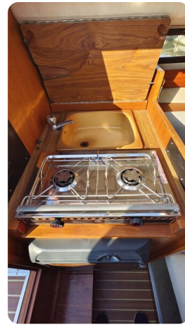
Windy 25 MIRAGE msp790159 28