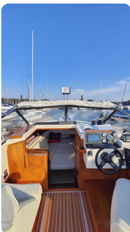
Windy 25 MIRAGE msp790159 45