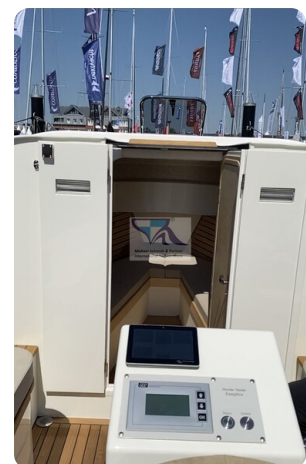
Tuck 22 8