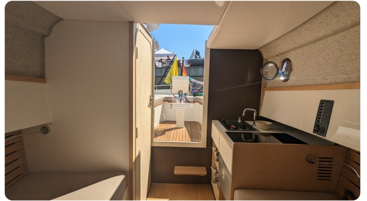
Tuck 22 13