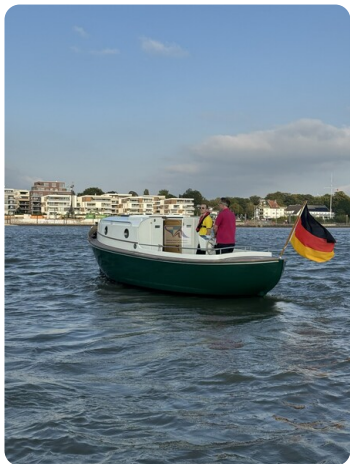
Tuck 22 26