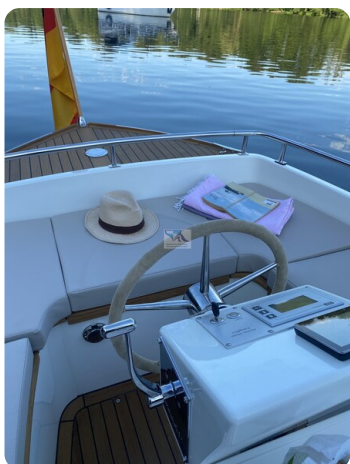
Tuck 22 7