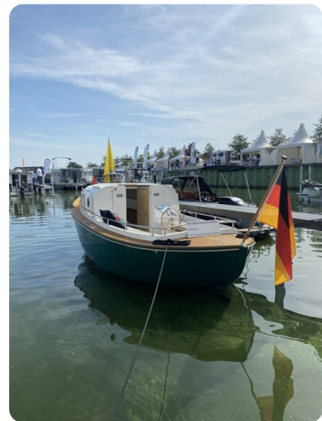
Tuck 22 21