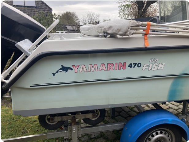
Big Fish 470 msp768487 9