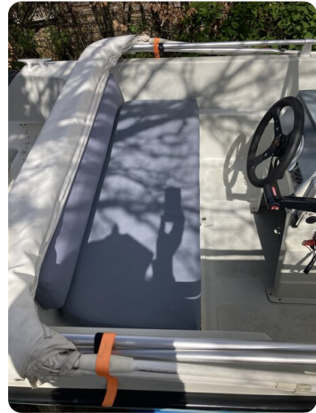
Big Fish 470 msp768487 10