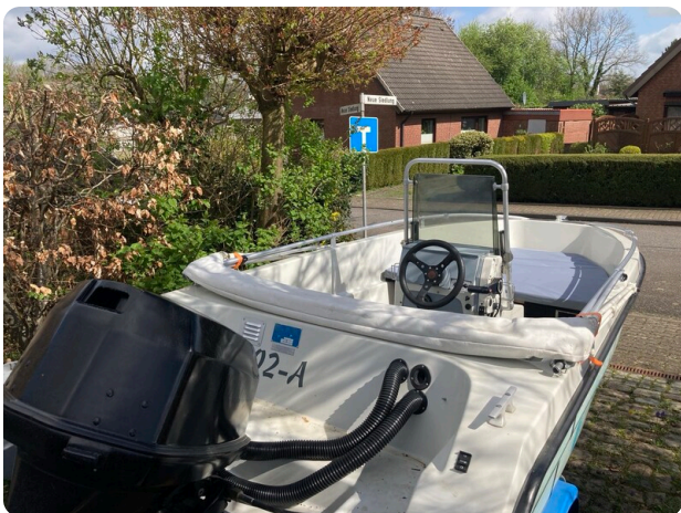
Big Fish 470 msp768487 11