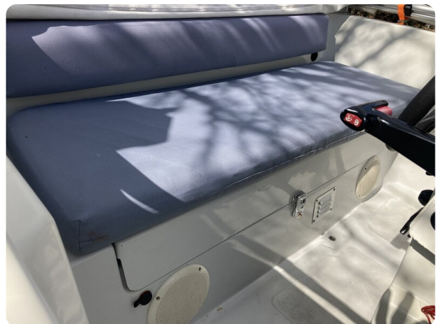
Big Fish 470 msp768487 12