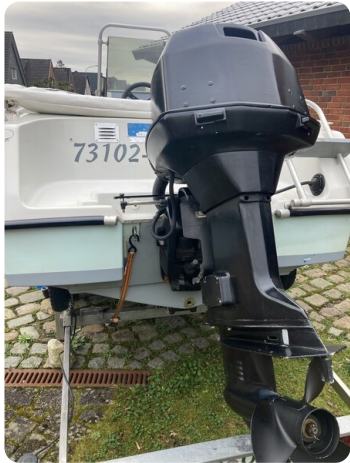
Big Fish 470 msp768487 15