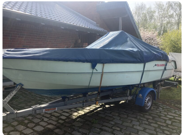
Big Fish 470 msp768487 4