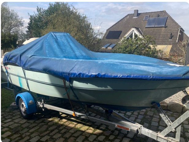
Big Fish 470 msp768487 5