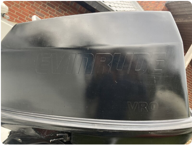
Big Fish 470 msp768487 13