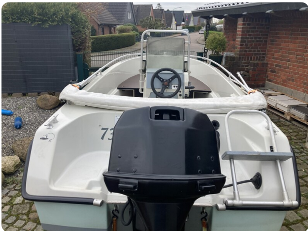
Big Fish 470 msp768487 3