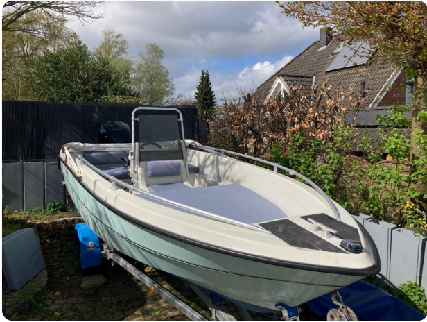
Big Fish 470 msp768487 1