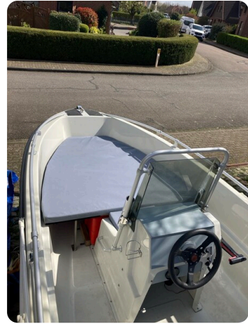
Big Fish 470 msp768487 8