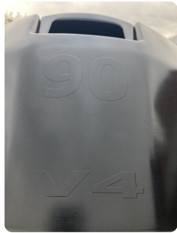
Big Fish 470 msp768487 14