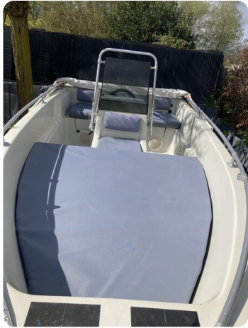
Big Fish 470 msp768487 7