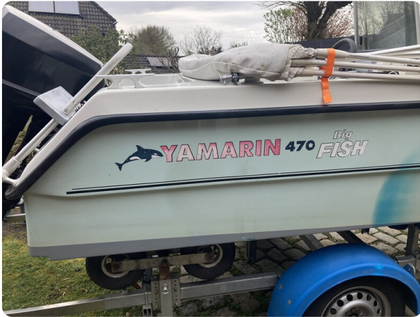
Big Fish 470 msp768487 9