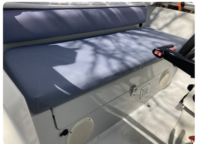
Big Fish 470 msp768487 12