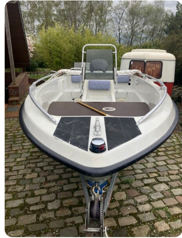
Big Fish 470 msp768487 2