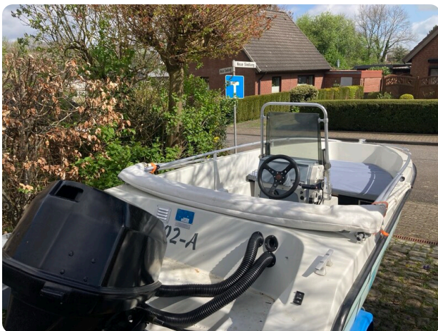
Big Fish 470 msp768487 11