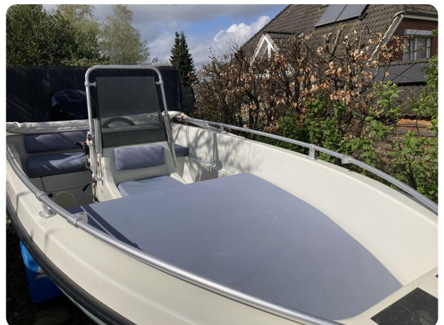
Big Fish 470 msp768487 6